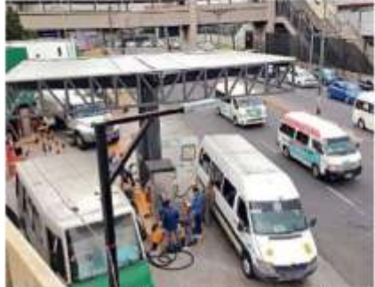
En la gasera se surte de combustible el transporte público, pero también cilindros caseros.

Asimismo, REFORMA observó en tres visitas diferentes que el tanque era abastecido por pipas de la empresa Luxor, incluso, en horarios de alta afluencia de pasajeros, como la salida y entrada de escuelas.