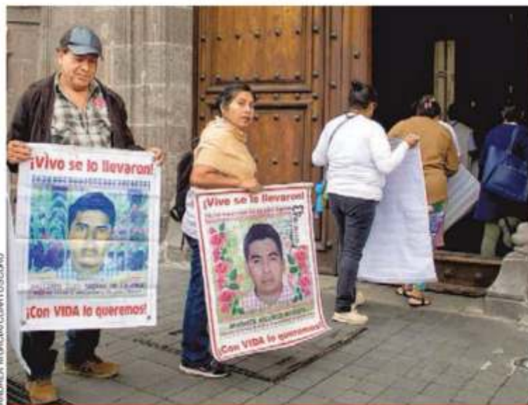
Padres de los 43 normalistas de Ayotzinapa ingresaron ayer temprano a Palacio Nacional para reunirse con el presidente Andrés Manuel López Obrador.

Sí. Los 43 podrían estar en Guerrero: Encinas