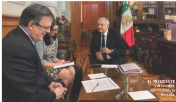
EL PRESIDENTE y el canciller, ayer, durante la llamada.