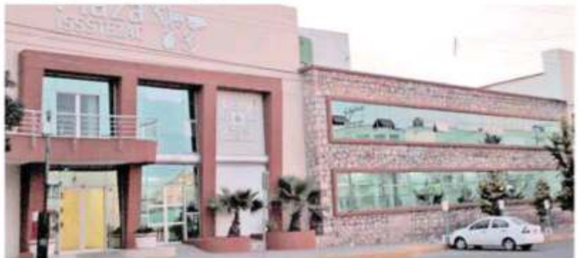
Pensiones del ISSSTEZAC, una bomba de tiempo para el gobierno de Zacatecas.

El estudio actuarial del grupo de Farell México Consultores que se tuvo en 2016 marca que el fondo de Pensiones alcanza diez años más.