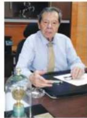
PORFIRIO MUÑOZ LEDO, en entrevista con La Razón , ayer.