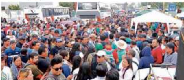
Los maestros disidentes mantuvieron ayer su plantón afuera de la Cámara de Diputados.

Los maestros confían en que estos acuerdos sean firmados en próximos días por