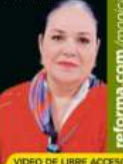
VIDEO DE LIBRE ACCESO