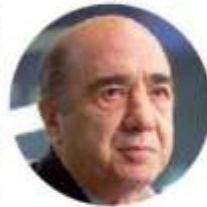
El exprocurador defendió su labor al frente de la indagatoria.