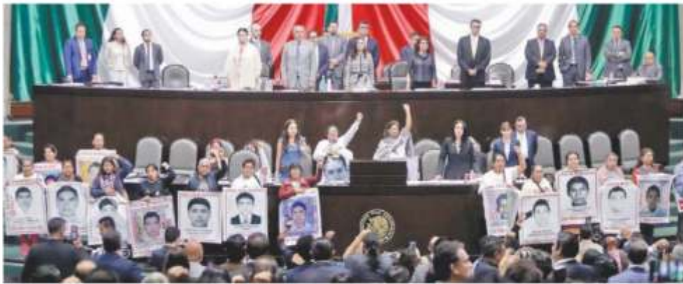
Padres de los 43 estudiantes desaparecidos subieron a la tribuna de la Cámara de Diputados para exigir celeridad en las investigaciones del caso.

● La Junta de Gobierno del organismo tomó la decisión de reducir el costo del dinero en 25 puntos base, a 7.75%, ante el entorno actual de riesgos. A33