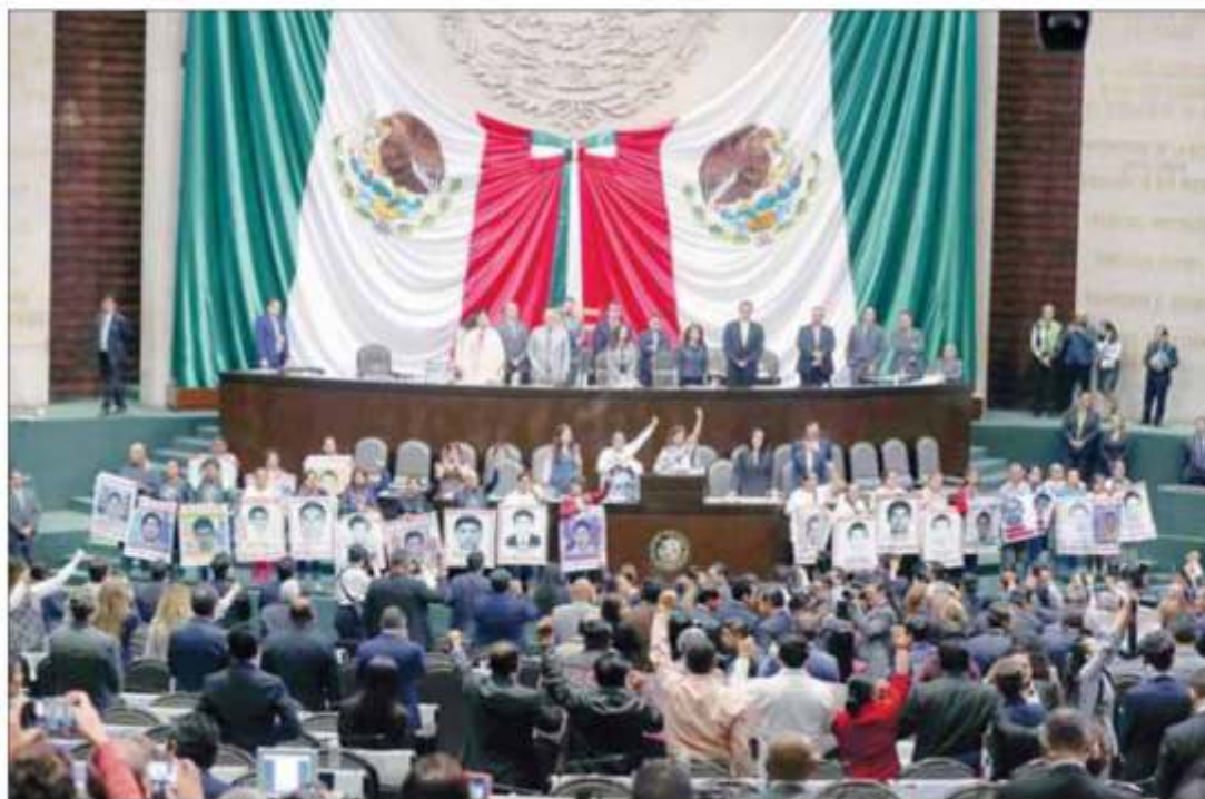
▲ Imágenes de los 43 normalistas de Ayotzinapa desaparecidos hace cinco años fueron desplegadas al pie de la tribuna de la Cámara de Diputados. Padres de las víctimas señalaron que "la transformación

que pretende este gobierno pasa por esclarecer las graves violaciones cometidas en Iguala". Exigieron procesos penales contra ex funcionarios que obstaculizaron la investigación.