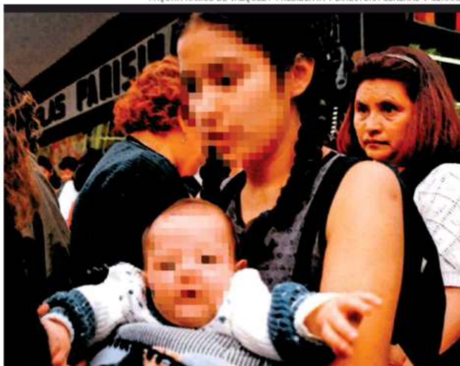
En lo que va de este 2019, la Secretaría de Salud atendió 123 embarazos en niñas menores de 14 años.