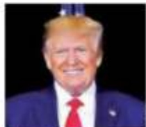
El Presidente Trump.

"Y quiero agradecerle a México: tienen 27 mil soldados. Piensen qué mal está eso, que estamos usando a México porque los demócratas no