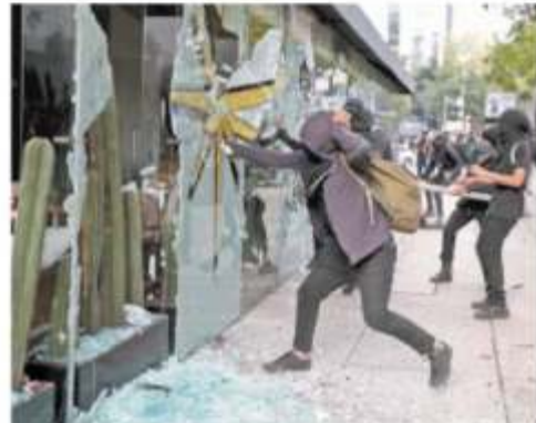
Un grupo de anarquistas causaron destrozos a negocios ubicados en la ruta de la marcha del Ángel de la Independencia al Zócalo. METROPOLI A22