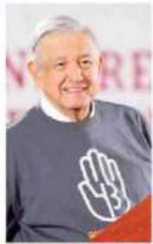
APERTURA HISTÓRICA. Por primera vez, los padres de los 43 normalistas desaparecidos pudieron hablar desde la tribuna de la Cámara de Diputados. "Antes nos trataron como disidentes", acusaron. También reconocieron que el actual gobierno les ha mostrado apoyo y confían en su compromiso de esclarecer los hechos ocurridos hace un lustro.