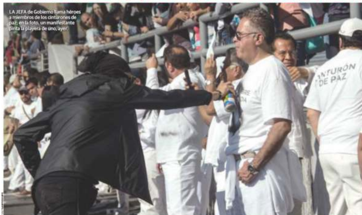
LA JEFA de Gobierno llama héroes a miembros de los cinturones de paz; en la foto, un manifestante pinta la playera de uno, ayer.

• Anarquistas agreden con pedradas y bombas molotov pero el operativo de policías, civiles y cerco aminora su capacidad violenta