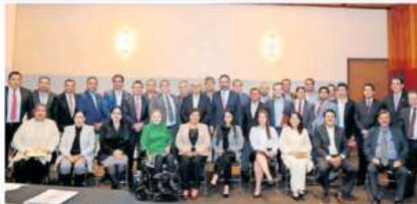
El gobernador Alejandro Tello, acompañado de alcaldes y empresarios, se reunió con los legisladores federales. "Estamos en sus manos", les dijo.

"Estamos en sus manos, realmente estamos en sus manos, porque si el presupuesto sigue la línea como hoy se presenta lo que nos llevará como Gobierno es a circunscribirnos más en una condición de reducciones, si quedáramos como estamos todos tendríamos