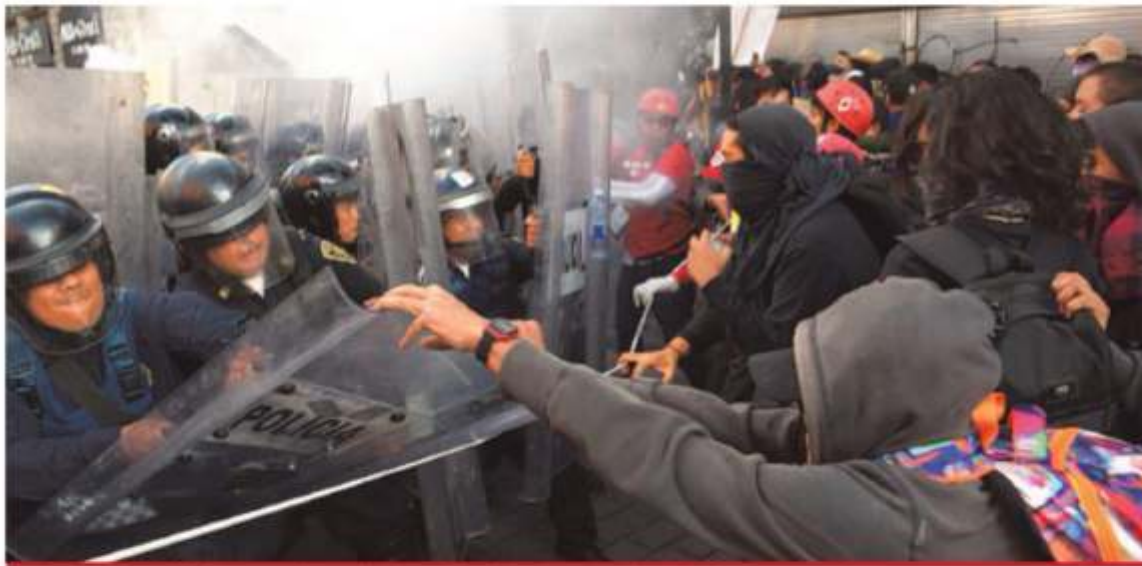
En su intento por llegar al Zócalo un grupo de encapuchados agredió a policías. Pintarrajearon los escudos y les lanzaron petardos.

Los encapuchados se incrustaron en la Marcha del 2 de octubre; tiran petardos y atacan a policías; ciudadanos de blanco, obligados a retirarse