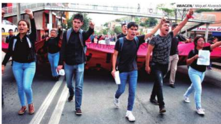
IMAGEN / Miquel Alvarado