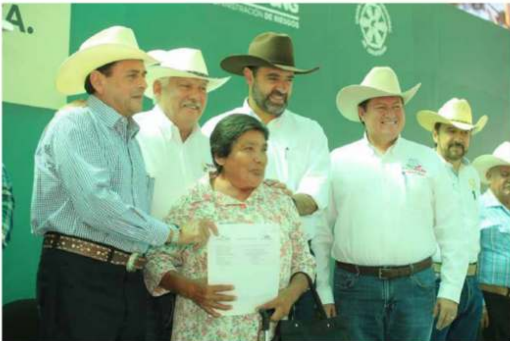
Del 9 al 14 de octubre también se dará cobertura a Apozol, Apulco, Cañitas, Jalpa, Juchipila, Luis Moya, Monte Escobedo, Nochistlán y Tepetongo

En Morelos Pagan Siniestros a 416 Productores por 3.6 mdp Entregan Tello y Secretario Víctor Villalobos Seguros de Daños Climáticos Para Productores de Villanueva