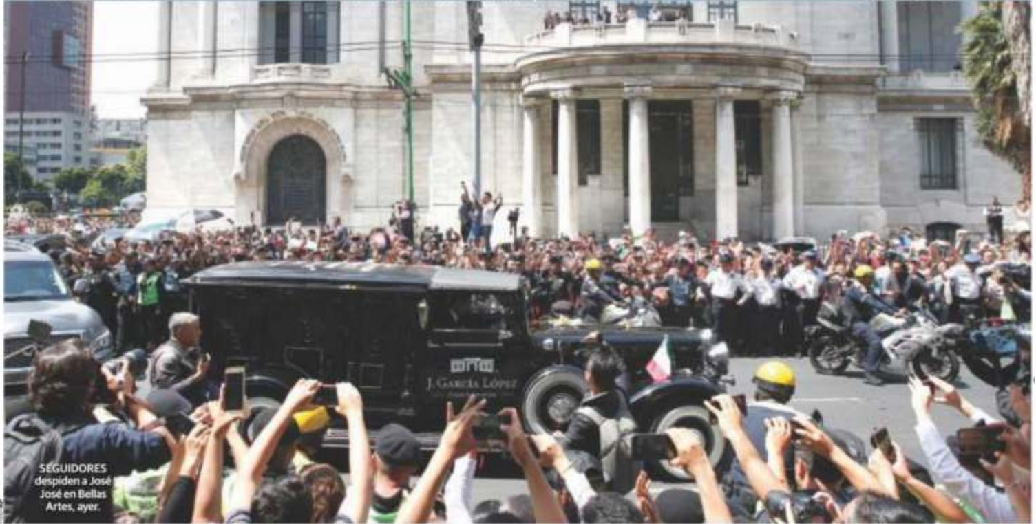
SEGUIDORES despiden a José José en Bellas Artes, ayer.

ONG LE RECLAMAN POR REPORTAR CERO CASOS EN EL SESNSP