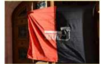
32 Universidades Públicas Realizan Paro Nacional

La 4T Está Exagerando la Austeridad: Martínez