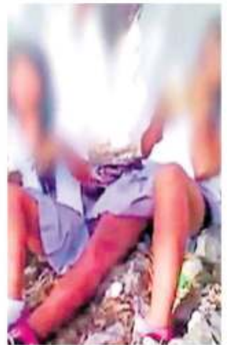
El consumo de drogas se ha convertido en un problema serio.

Los casos que se detectan, en primera instancia, se someten a terapias de tipo breve realizadas por especialistas en psicología, involucrando no sólo al alumno sino a toda su familia. Pág. 8