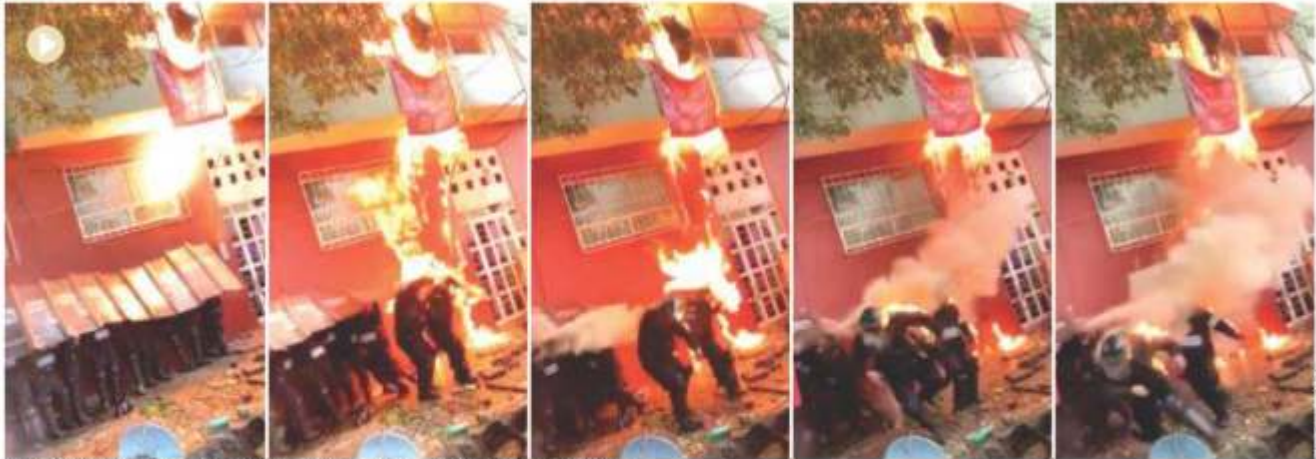
VECINOS arrojan tanques de gas y prenden fuego a policías, ayer en la colonia Alfonso XIII.

Inquilinos ligados a Los Claudios se resisten a orden judicial en Álvaro Obregón y atacan a agentes con piedras, bombas molotov...; hay 17 heridos; acusan abusos y GCDMX ofrece indagar. pág. 14