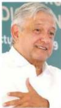
El Presidente visitó ayer San Luis Potosí y Zacatecas.

Alfonso Durazo, secretario de Seguridad, señaló que no caerá en "la idea conservadora", de que la fuerza lo resuelve todo, pues será el último recurso.