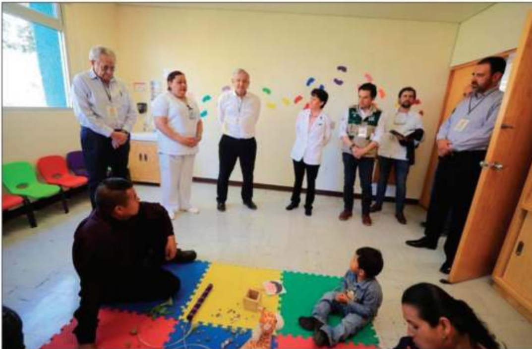
López Obrador anunció la reciente puesta en marcha de las oficinas de Seguridad Alimentaria Mexicana (Segalmex) en Zacatecas, con lo que también se comprometió como Presidente electo