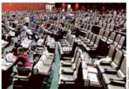
Una vez aprobada la ley en lo general, los diputados abandonaron el salón de plenos durante la votación en lo particular.