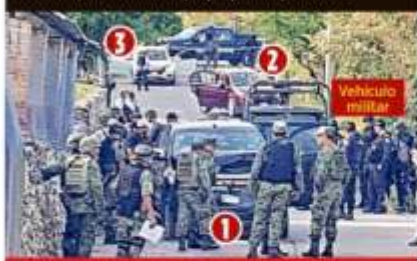
DELINCUENTES EN 3 CAMIONETAS

Las versiones del choque ocurrido el martes en Tepochica, Guerrero, con 15 muertos, dejan puntos por aclarar.