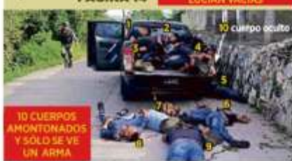
10 CUERPOS AMONTONADOS Y SOLO SE VE UN ARMA