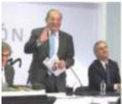
CARLOS SLIM, ayer en conferencia.