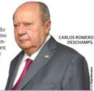
CARLOS ROMERO DESCHAMPS

Carlos Romero Deschamps Exdirigente petrolero