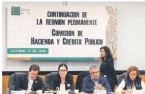
DIPUTADOS. El Paquete de Ingresos debe aprobarse a más tardar el 20 de octubre.