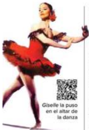
Giselle la puso en el altar de la danza