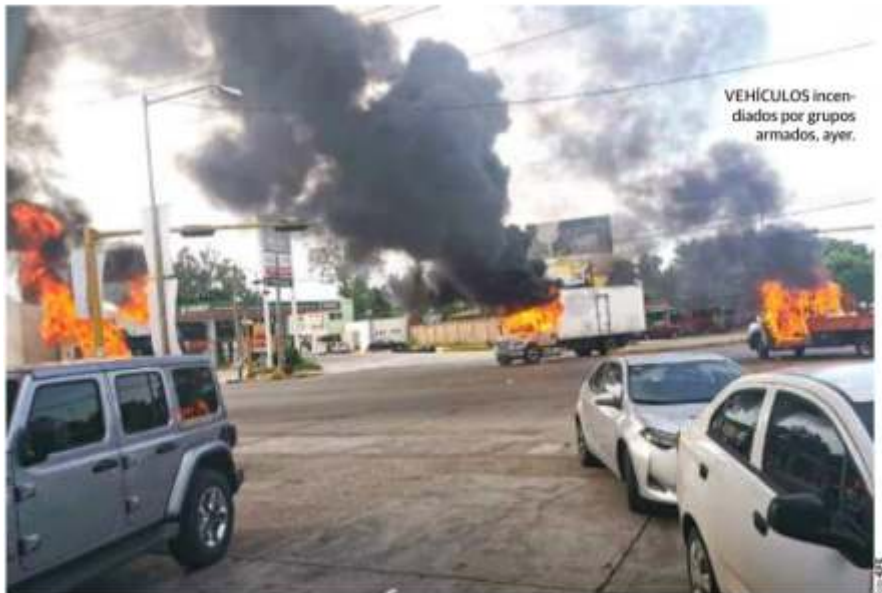
VEHÍCULOS incendiados por grupos armados, ayer.

www.razon.com.mx VIERNES 18 de octubre de 2019 • Nueva época • Año II Número 1230 PRECIO • $10.00