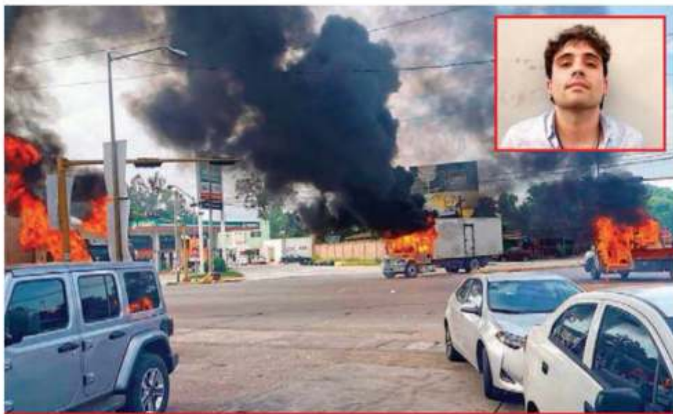
Varios vehículos fueron quemados en zonas de Culiacán, luego de la supuesta detención de Ovidio Guzmán López en un fraccionamiento de esa ciudad.