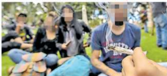
El consumo de drogas entre los jóvenes se incrementa en Zacatecas.

Los representantes populares, también pidieron a las autoridades educativas reintegrar a las alumnas a sus actividades escolares, ya que luego de divulgarse su conducta en redes sociales, la dirección de la escuela las castigó suspendiéndolas durante un año. Pág. 9