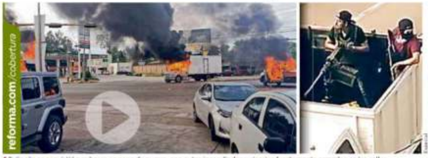
■ Culiacán se convirtió por horas en zona de guerra, con autos incendiados y sicarios fuertemente armados en las calles.

Torna cártel Culiacán; siembra terror, saca a reos de cárcel y rescata a su líder REFORMA / STAFF Elementos de la Guardia Nacional entregaron a miembros del Cártel de Sinaloa a Ovidio Guzmán López, uno de los hijos de Joaquín "El Chapo" Guzmán, luego de haberlo detenido de manera casual en un operativo. La detención de Ovidio en una casa del fraccionamiento Tres Ríos en la capital sinaloense desató una ofensiva inusitada del Cártel de Sinaloa cuyos integrantes tomaron la ciudad, desataron el terror en sus calles, bloquearon carreteras, incendiaron autos y camiones, liberaron a 27 reos y rodearon el sitio donde estaba detenido el líder para rescatarlo. Según la versión oficial, la tarde de ayer una patrulla de la Guardia Nacional fue agredida desde una casa por sicarios y al entrar a ese domicilio encontraron a Ovidio Guzmán. "El personal de la patrulla repelió la agresión y tomó control de la vivienda, localizando en su interior a cuatro ocupantes, uno de ellos era Ovidio", señaló el Secretario de Seguridad Ciudadana Alfonso Durazo en un video transmitido desde la cuenta de Twitter de la Secretaría a las 20:30 horas. Acompañado de los titulares de la Defensa y Marina, y del comandante de la GN y titular del Centro Nacional de Inteligencia, Durazo dijo que estas detenciones generaron que "varios grupos" de la delincuencia organizada rodearan la vivienda con una fuerza mayor a la patrulla.