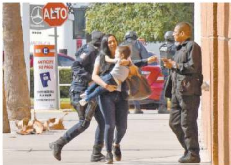
Pesa del miedo, una mujer carga a su hijo y busca dónde protegerse de los ráfagas de armas de fuego.