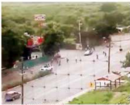
"LOS ESTÁN LIBERANDO"

Los sicarios incendiaron autobuses, otras unidades pesadas y autos particulares para impedir la movilización de autoridades. En redes sociales circularon videos que muestran a los ciudadanos escondidos y temerosos. Al cierre de esta edición no se reportó saldo oficial de daños.