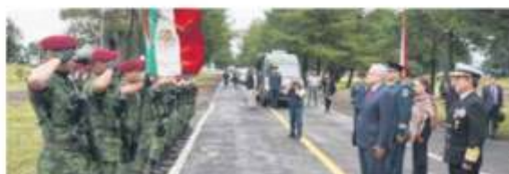
ARRANCAN. Ceremonia de inicio de actividades para construir el aeropuerto.