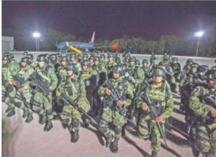
Tras las balaceras del jueves, 230 militares de élite arribaron ayer a Colliacán para reforzar la seguridad.