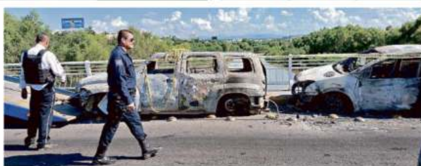
Las huellas de la batalla ocurrida el jueves permanecieron prácticamente todo el día de ayer en las calles de Culiacán.

"Ahí es donde se encuentran con este retén y una cantidad de gente adicional armada; retienen a un oficial, cuatro de tropa, un vehículo y armas, que posteriormente son regresados sin lesiones", admitió el General, quien no juzgó la familiaridad de trato entre uniformados y sicarios.