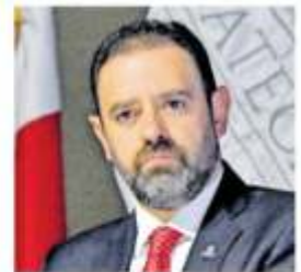
Alejandro Tello, gobernador.

Dicho dispositivo de seguridad, se informó, que desde la noche del jueves se puso en marcha, contempla el reforzamiento de los operativos de seguridad en los municipios de Mazapil, Concepción del Oro, Miguel Auza y Juan Aldama, ello con el objetivo de preservar el orden y velar por la seguridad de las y los zacatecanos. "El operativo durará todos los días que sean necesarios para dar tranquilidad". Pág. 6