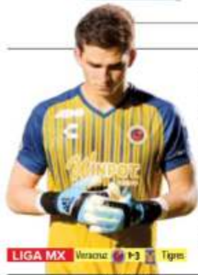
LIGA MX Veracruz P-3 Tigres

SÁBADO 19 DE OCTUBRE DE 2019 • AÑO CIII TOMO V, NO. 37,299 • CIUDAD DE MÉXICO 76 PÁGINAS $15.00