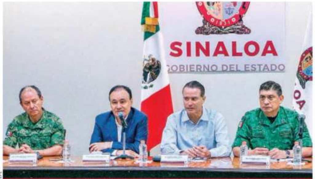
Alfonso Durazo (SSPC), acompañado del almirante José Rafael Ojeda Durán (Semar), Quirino Ordaz Coppel (gobernador de Sinaloa) y el general Luis Crescencio Sandoval (Sedena), durante la conferencia ofrecida la mañana de ayer en Culiacán, Sinaloa.

La miscelánea fiscal pasa en la Cámara como la quiere Hacienda