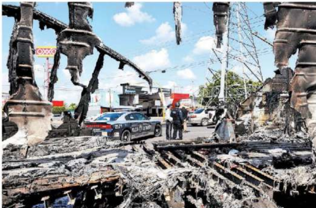
La ofensiva del cártel de Sinaloa concluyó con 8 muertos, 14 heridos, 19 bloqueos y 51 reos evadidos. JOHGE CARRILLO