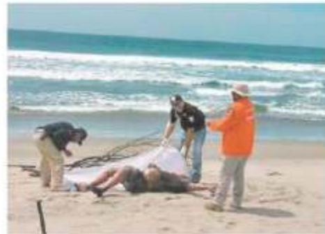
El cadáver de un migrante, que viajaba en una lancha que naufragó el pasado 11 de octubre, fue localizado a la orilla del mar.