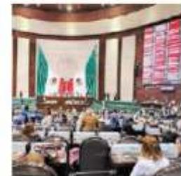
Debate en San Lázaro. ESPECIAL