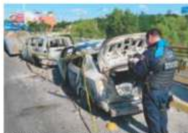
POLICÍAS , ayer, en el retiro de vehículos quemados.

SEDENA refiere errores: precipitación, no se avisó a mandos y se retrasó 2 horas una orden de cateo