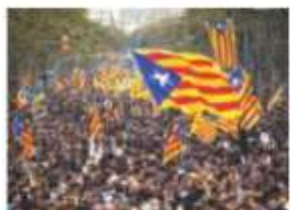
MARCHA, ayer, en Barcelona.