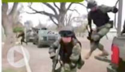
En el video, se muestra a soldados en diversos operativos.