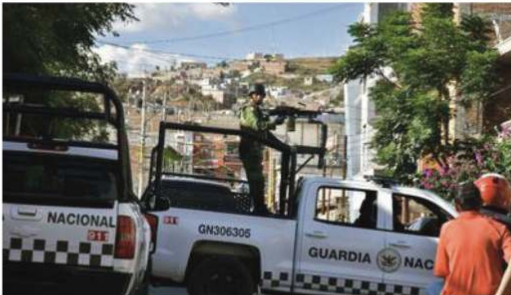
La violencia no cesa