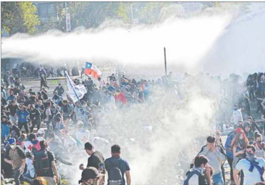
▲ La policía utilizó ayer gases lacrimógenos para dispersar a manifestantes en Santiago, la capital. Aunque el gobierno de Sebastián Piñera dio marcha atrás al incremento a la tarifa del Metro, el reclamo

Las peores protestas desde el retorno a la democracia en 1990