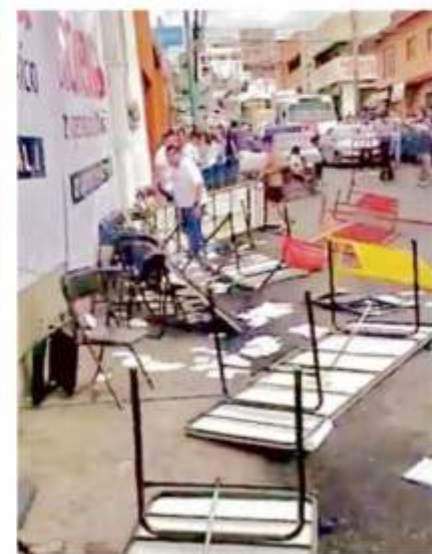
En Cuernavaca, jóvenes voltearon la mesa de registro.