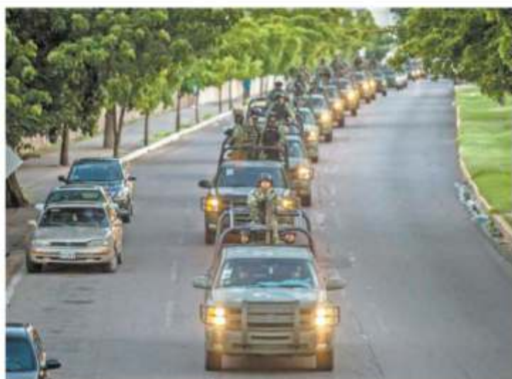
Convoyes del Ejército Mexicano patrullaban ayer las calles de Culiacán, Sinaloa.