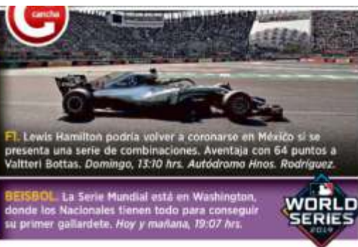
F1. Lewis Hamilton podría volver a coronarse en México si se presenta una serie de combinaciones. Aventura con 64 puntos a Valtteri Bottas. Domingo, 13:10 hrs. Autódromo Hnos. Rodríguez.

Conoce otras recomendaciones en: reforma.com/yaesviernes