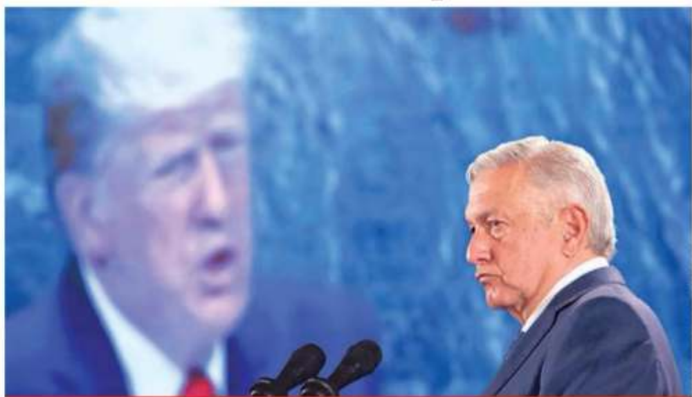
El presidente Andrés Manuel López Obrador, durante su conferencia de prensa matutina en Palacio Nacional.