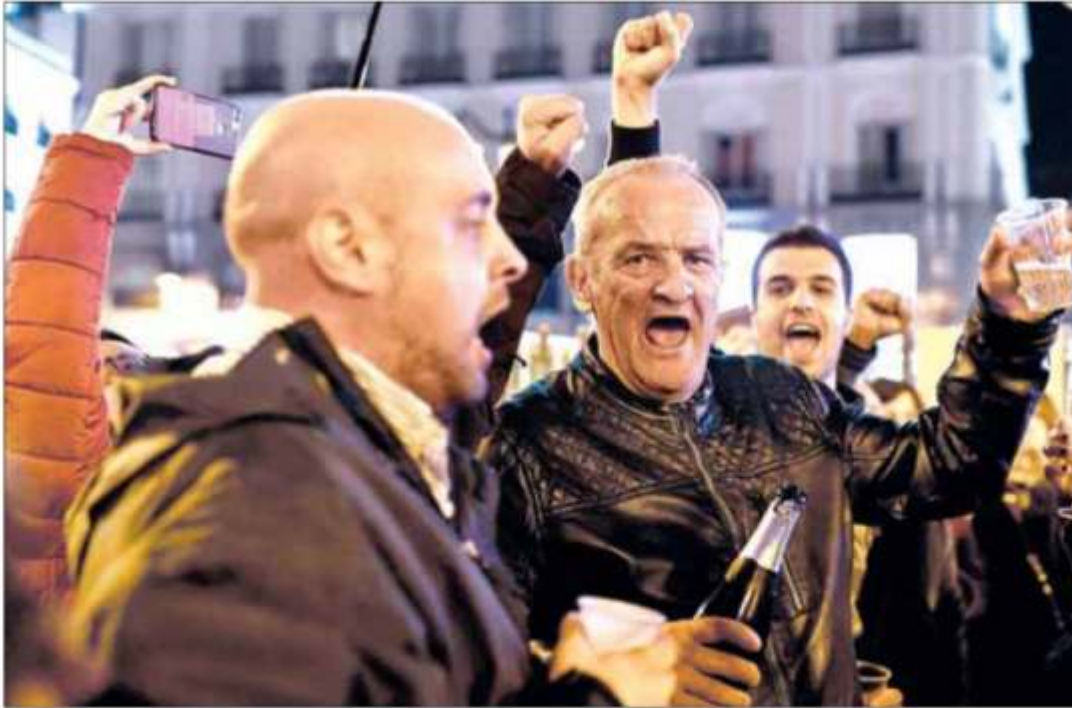
▲ En la Puerta del Sol, en Madrid, fue celebrada la exhumación del dictador Francisco Franco, quien sometió a la muerte, la cárcel o el exilio a cientos de miles de sus compatriotas. Los restos permanecían