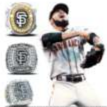
2010, 2012, 2014 Sergio Romo Gigantes de San Francisco

El mexicano Sergio Romo ha sido tres veces acreedor del valioso anillo de campeón de las Grandes Ligas, el premio más deseado. El máximo ganador es Yogi Berra de los Yanquis con 10.