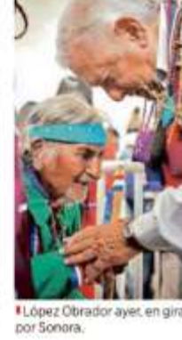
■ López Obrador ayer, en gira por Sonora.

Ayer, apenas llegó López Obrador a la localidad, fue ataviado con collares de conchas y buenos de tiburón. "Es como Echeverría, pero mejor, porque con Echeverría hubo mucha inflación", dijo Morcohal, un "yori", es decir, un hombre blanco que vive con los seris. Pero fue el mismo Presidente quien regresó en el tiempo. "Se critica mucho a los años 70, 80, antes de que impusieran la política neoliberal. En el caso de la política para los pueblos indígenas, antes, en los años 70, hasta en los años 80, había atención a los pueblos indígenas", destacó.