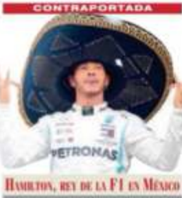
HAMILTON, REY DE LA F1 EN MÉXICO

Investigan red de administradores que manejan fantasmas y negritos