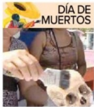
DÍA DE MUERTOS

SÁBADO 2 DE NOVIEMBRE DE 2019 • AÑO CIII TOMO VI, NO. 37,313 • CIUDAD DE MÉXICO 72 PÁGINAS $15.00