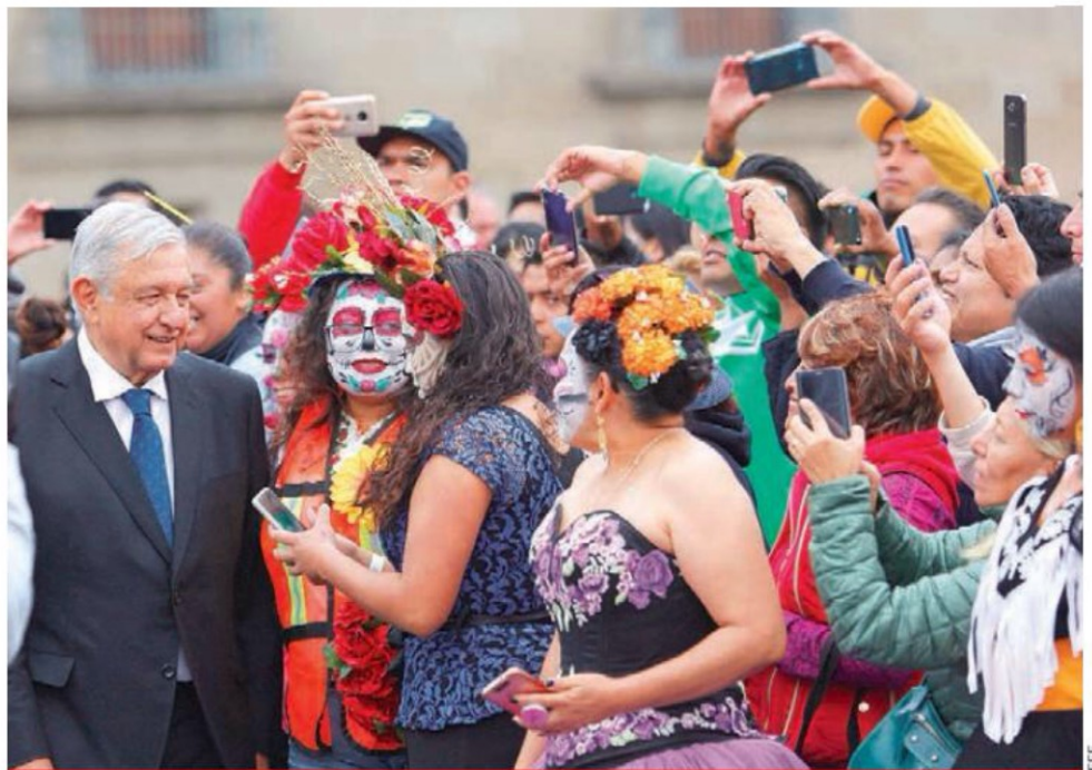
A la salida de Palacio, el presidente López Obrador fue rodeado por participantes de las festividades y conmemoraciones del Día de Muertos.