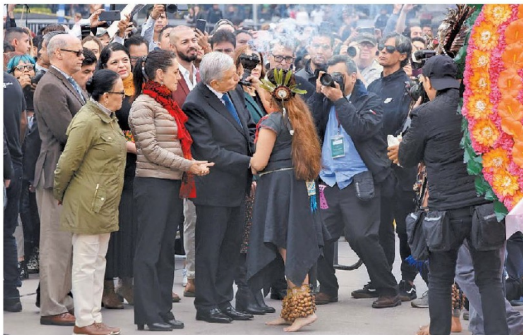
El titular del Ejecutivo viajó a Tabasco luego de inaugurar la ofrenda monumental en el Zócalo. JUAN CARLOS BAUTISTA