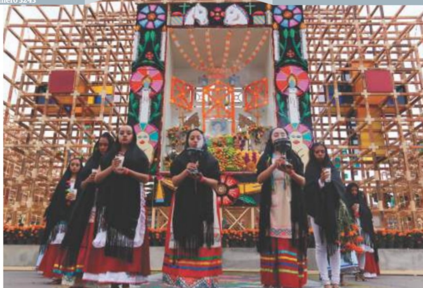
UNO de los altares instalados en la plancha del Zócalo, ayer.

◉ "Tienen que irse con el mismo amor", dice María Soto al dar el último adiós a Caramelo, su french; en 1998 la primera de seis empresas funerarias en la CDMX cremó a 100 animales, en 10 meses ya van 4 mil pág. 10