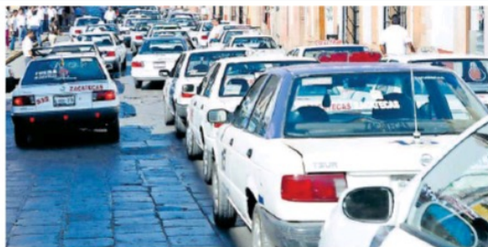
En la mira, 11 concesiones de taxistas.

Aunque son 11 las concesiones que están en observación, al momento, como producto de estos procesos, no se ha cancelado ni una sola. Pág. 6