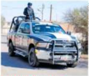
EL SOL DE ZACATECAS