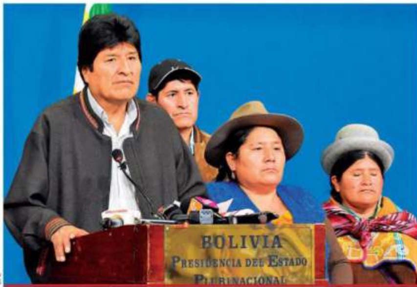
Evo, al convocar a nuevas elecciones. Un par de horas después renunció; "ni el llamado a nuevas elecciones les bastó", dijo.