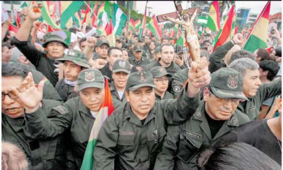
Las fuerzas armadas retiraron su apoyo al gobierno de Evo Morales y presionaron junto con las protestas para su salida.

En el último año, las importaciones de gasolina china se incrementaron 55 por ciento, con lo cual ese país se convirtió en segundo proveedor de combustibles en México, sólo después de Estados Unidos. Pág. 21