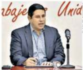
EL SOL DE ZACATECAS

Cuatro cuerpos encostados y con señas de tortura fueron encontrados en las primeras horas de este domingo en el municipio de Chalchihuites. Pág. 12