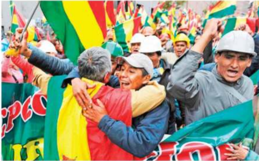
"SI SE PUDO"

— Con información de AFP y Reuters PRIMERA | PÁGINAS 28 Y 29