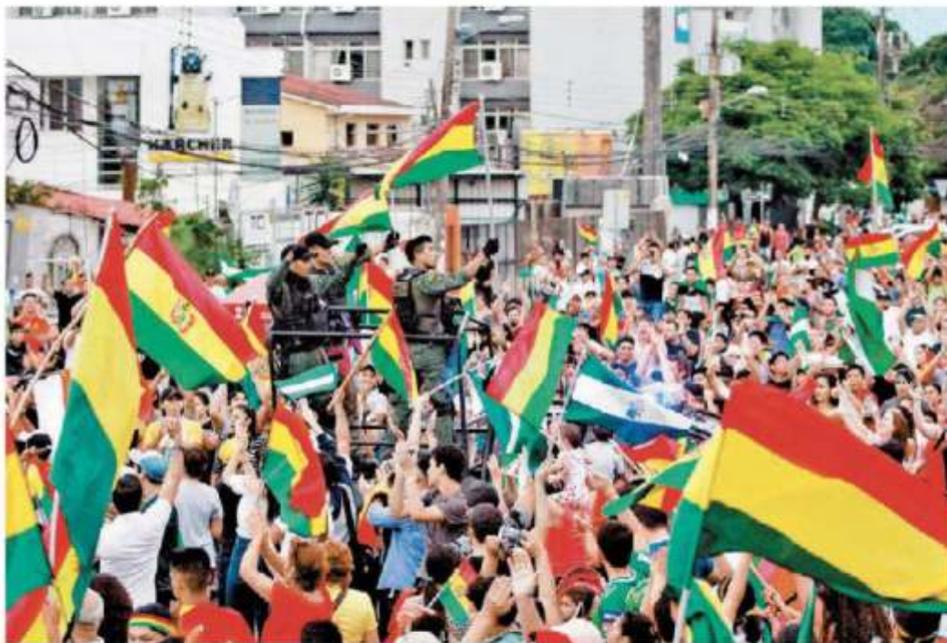
Miles de opositores al régimen, incluidos policías y militares, salieron a las calles de La Paz.