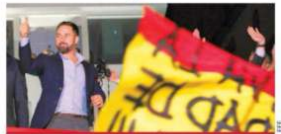
El presidente de Vox, Santiago Abascal, saluda a sus simpatizantes en Madrid.

Lorenzo Córdova llama a defender la democracia; "si no lo hacemos, se nos puede ir de las manos"