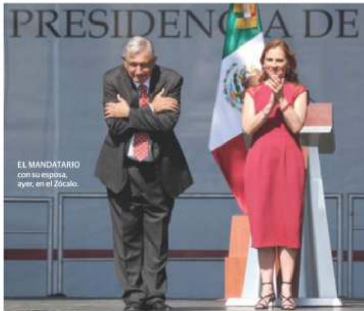
EL MANDATARIO con su esposa, ayer, en el Zócalo.

ESTRATEGIA desquiciada de seguridad no se repetirá; falta de crecimiento, pero se distribuye mejor la riqueza, sostiene pág. 3