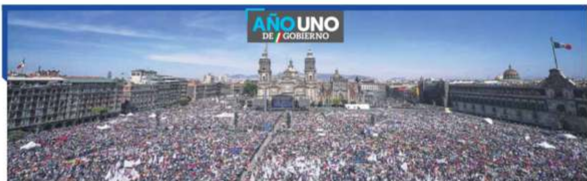
AL PUEBLO. Ante un Zócalo lleno de ciudadanos, empresarios, políticos y académicos, entre otros, el presidente prometió seguir escuchando a su 'ángel de la guarda'.