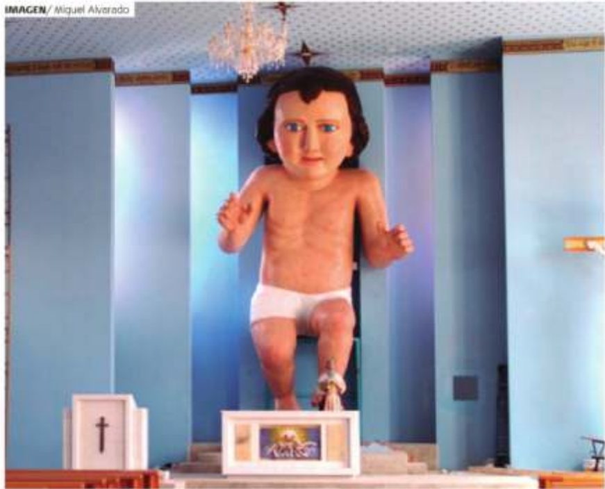
FE Y VOLUNTAD , son las características de los habitantes de Zóquite, quienes trabajaron 10 años en edificar un nuevo templo

Sin proponérselo, los habitantes de Zóquite construyeron el Niño Dios más grande el mundo, lo que colocó a la comunidad en los reflectores internacionales. Pero esa no es su única aportación, también está su nuevo templo de más de 6 millones de pesos, cuyos vitrales costaron hasta 95 mil pesos cada uno. ALEJANDRO NÁJERA / PÁG. 8 Y 9