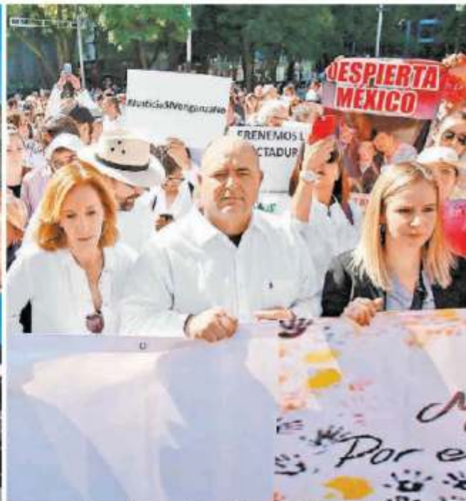
López Obrador dedicó 20 minutos a saludar y tomarse fotos con sus huéspedes. ESPECIAL. La manifestación opositora terminó en el Monumento a la Revolución. ARIANA PÉREZ.