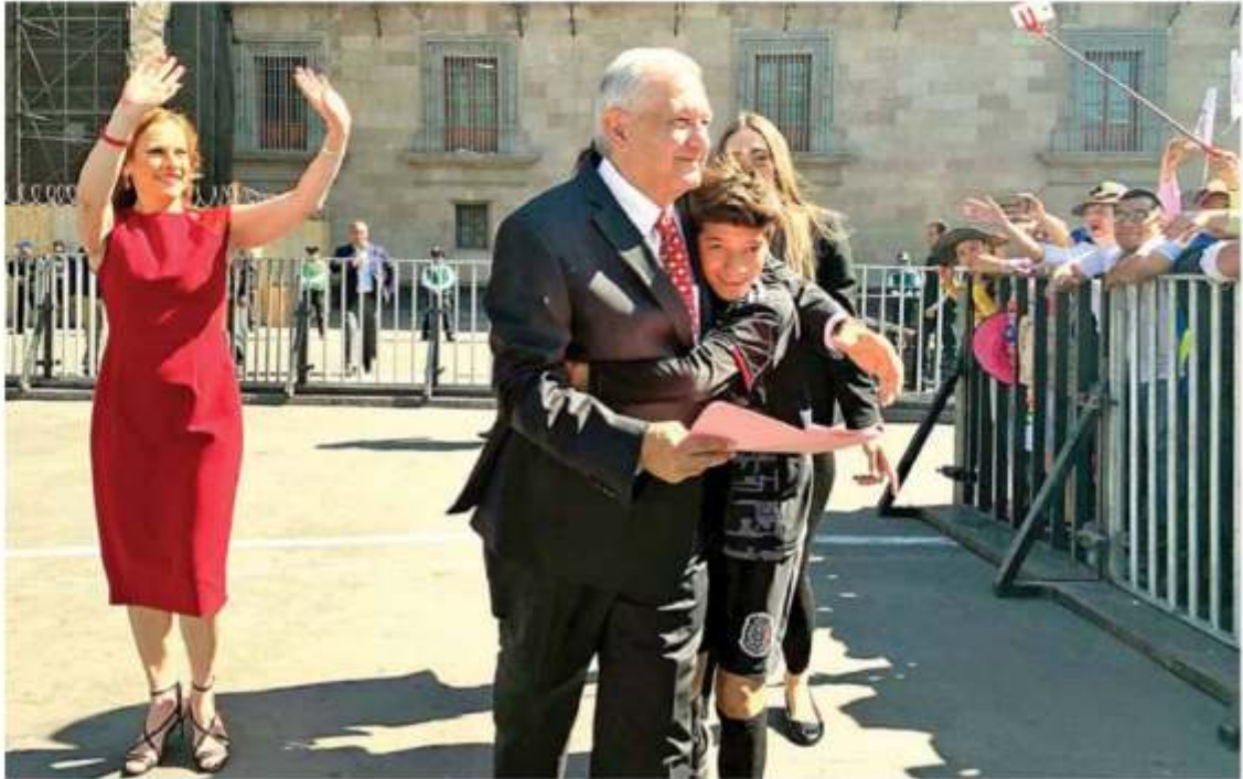
ABRAZA A COLADO Cuando López Obrador caminaba hacia el escenario, un niño traspasó la valla de seguridad para abrazarlo. Al Presidente lo acompañó su esposa, Beatriz Gutiérrez Müller.