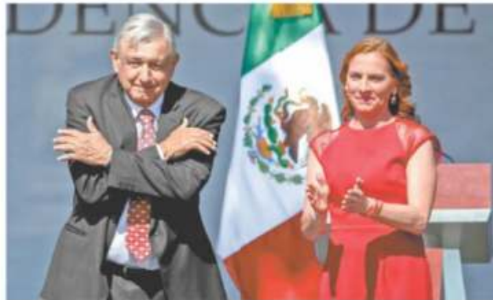
En el Zócalo de la Ciudad de México, el presidente Andrés Manuel López Obrador subió al estrado acompañado de su esposa Beatriz Gutiérrez Müller para dar un mensaje con motivo de su primer año de gobierno.