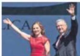
NUEVA PATRIA. En diciembre de 2020.

En su discurso, ante un Zócalo lleno, dijo: "Lo viejo no acaba de morir y lo nuevo no termina de nacer".