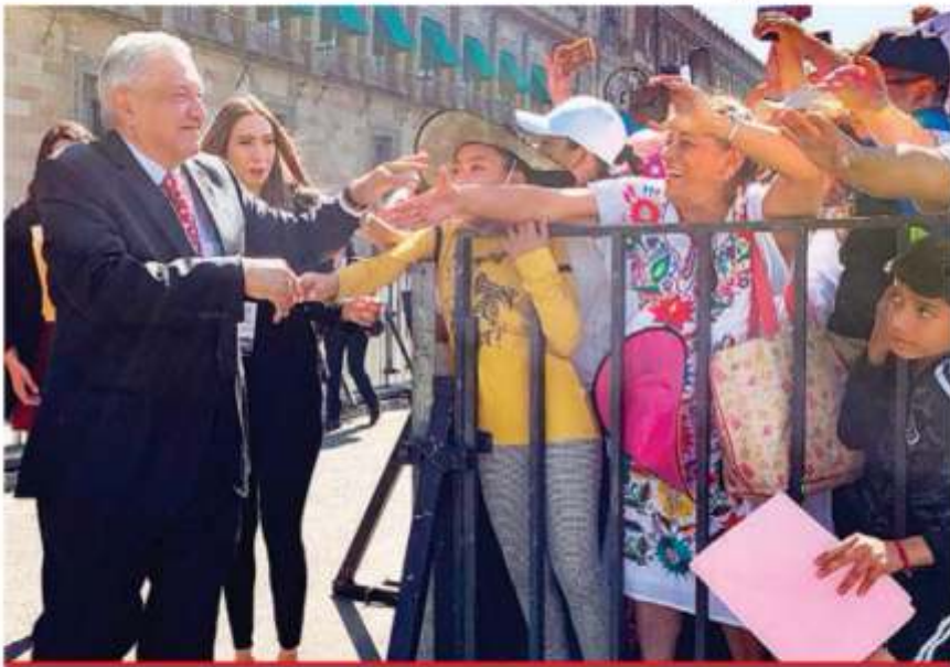
El presidente Andrés Manuel López Obrador saluda a ciudadanos al salir de Palacio Nacional para dar su mensaje.

El Presidente reconoce que el crecimiento económico no es el deseado; asegura haber cumplido 89 de los 100 compromisos hechos