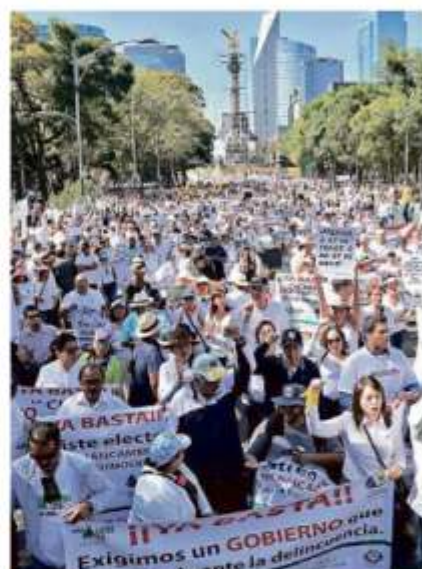
La marcha partió del Ángel al Monumento a la Revolución.

"Yo creo que tenemos que trabajar juntos para encontrar la forma de detener la violencia; lo que hemos hecho hasta ahora no nos ha