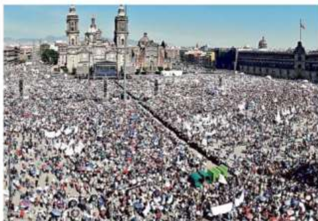
El Presidente confió en que para 2020 ya no se podrán revertir los cambios que ha impulsado.