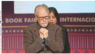
EL POETA, el sábado, al recibir el Premio FIL de Literatura 2019.