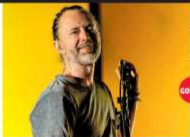
CORPESHA THOM YORKE

El músico británico, quien ha visitado nuestro país con Radiohead, se presentará por primera vez en México en solitario con su espectáculo Tomorrow's Modern Boxes. También tocarán los Chemical Brothers en el Campo Marte de la capital.