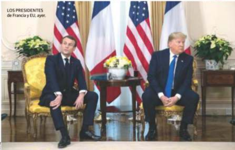
LOS PRESIDENTES de Francia y EU, ayer.

En medio de tensiones por aranceles, y por las declaraciones del francés sobre la "muerte cerebral" del organismo multilateral, el magnate le advierte que puede enviarle a su casa combatientes del Estado Islámico; Macron le pide seriedad. pág. 24