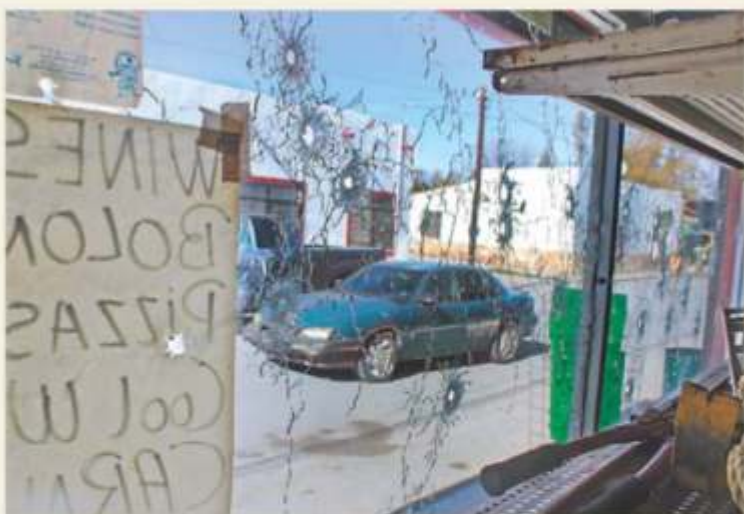
ESTAIOS A26 Impactos de bala en las ventanas de los comercios son las huellas del tiroteo del sábado pasado en Villa Unión.