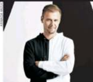
ARMIN VAN BUUREN