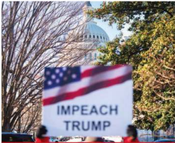
Con el inmueble del Capitolio al fondo, en Washington DC, un cartel anunció ayer muy temprano el juicio político a Trump.

Los representantes aprobaron el impeachment . Al Presidente lo enjuician por abuso de poder con 230 votos a favor y 197 en contra; y por obstrucción al Congreso con 229 a favor y 198 en contra