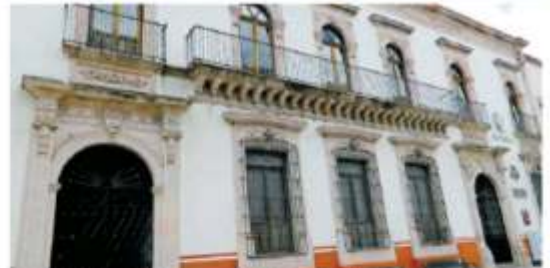
Incumplió la Rectoría en el pago de aguinaldos.