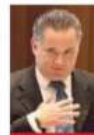
Santiago Nieto, de la UIF, investiga.