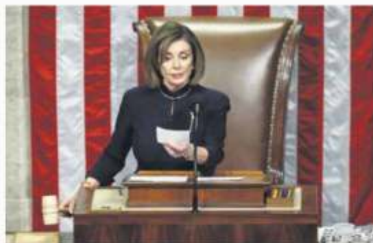
IMPEACHMENT. Nancy Pelosi aseguró que el mandatario republicano no les dejó otra opción; Trump afirmó que los demócratas están consumidos por el odio.

ALIANZA CON Bloomberg ECONOMÍA, MERCADOS Y NEGOCIOS