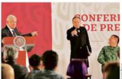
El Presidente y los Secretarios de Seguridad, Alfonso Durazo y de la Defensa, Luis Crescencio, en la mañana de ayer.

Las ventas de El Buen Fin 2019 crecieron solo 4.5 por ciento en comparación con la edición de 2018 y no el 7 por ciento estimado previamente, según dio a conocer la Secretaría de Economía.