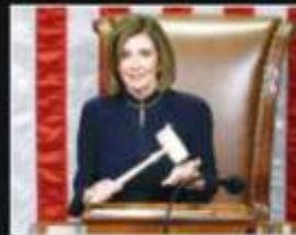
NANCY Pelosi, ayer, durante la discusión.

Tensión y llamados a la unidad ante diferendo 4T-góbers por inseguridad