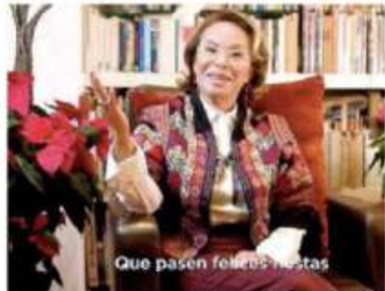
Que pasen felices estas