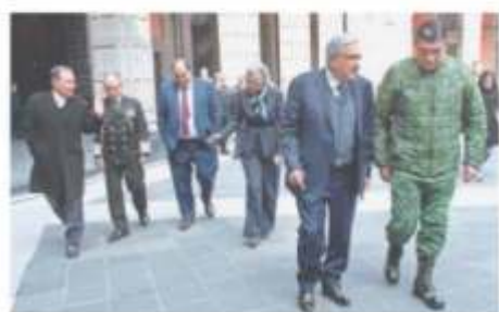
Andrés Manuel López Obrador y los secretarios de Defensa, Seguridad, Marina y Gobernación, al salir de la reunión con gobernadores.