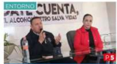
Advierte la Dirección de Policía de Seguridad Vial que no habrá tolerancia para quien maneje alcoholizado