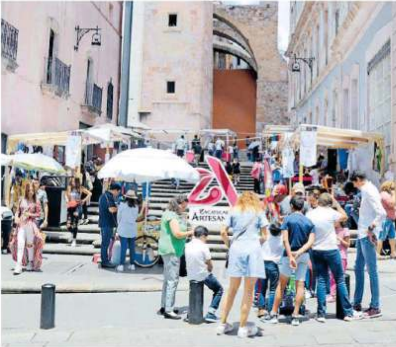
EL SOL DE ZACATECAS