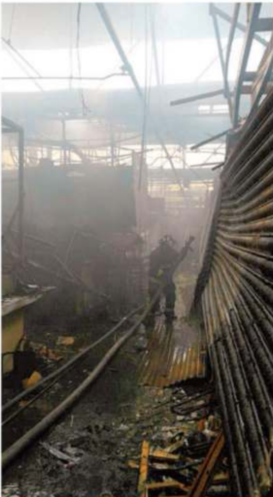
El fuego consumió 188 de 252 locales del centenario mercado capitalino. 10

Incendio destruye 75% del mercado de San Cosme