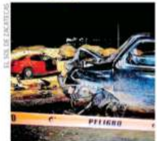
EL SOL DE ZACATECAS