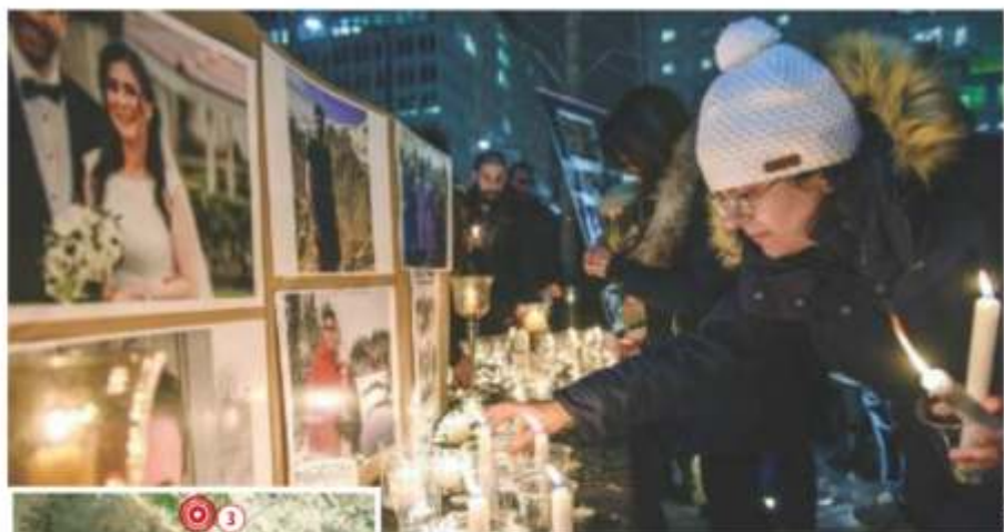
EN MONTREAL ponen memorial para las víctimas.