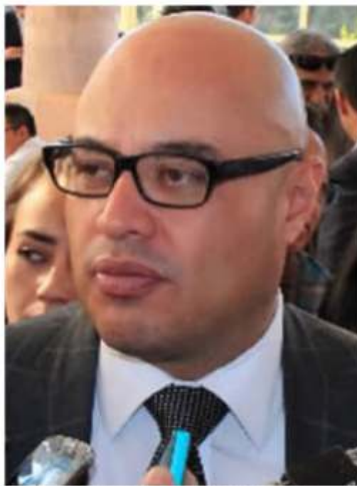
Francisco Murillo Ruiseco, titular de la Fiscalía General de Zacatecas