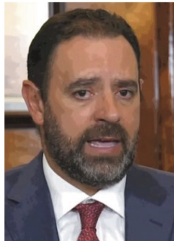
Alejandro Tello Cristerna

- Y ES QUE el gobernador Alejandro Tello Cristerna “El Pinocho de Bernárdez”,