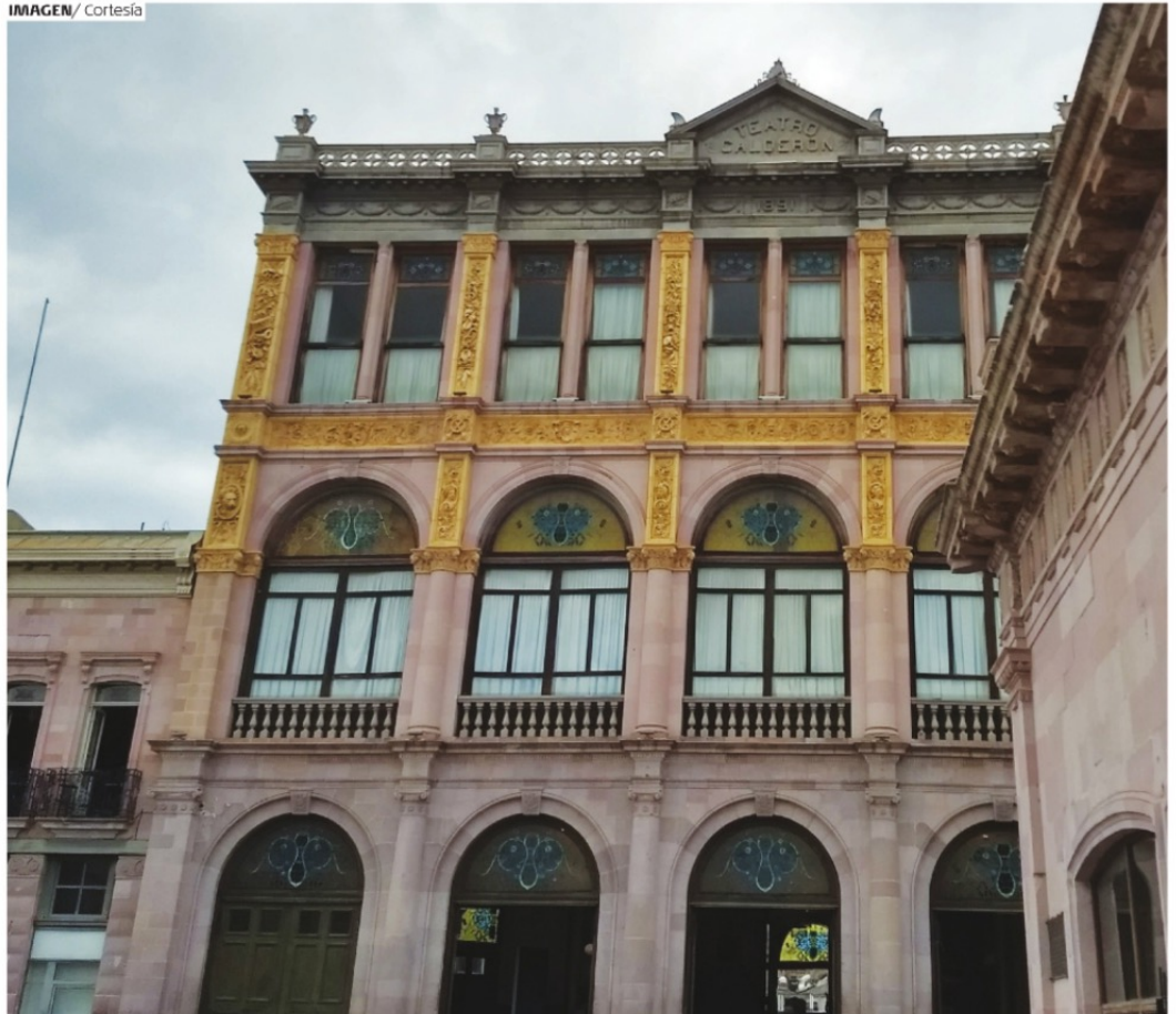
EN EL TEATRO FERNANDO CALDERÓN estrenó su obra "Fantasía Heroica".

como director y lo hizo bajo tan buenos auspicios que en 1900 fue requerido por el general Pedro L. Rodríguez, gobernador constitucional del Estado de Hidalgo, para que organizara y dirigiera la Banda de Rurales de esa entidad federativa, para lo cual ofrece un concierto inaugural el 20 de enero de 1901.