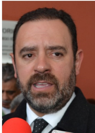
Alejandro Tello Cristerna

“Alejandro Tello”; el problema es que todo el gabinete del “Bobernador” se contagió y dicen cada mentira que ni ellos mismos se la creen.