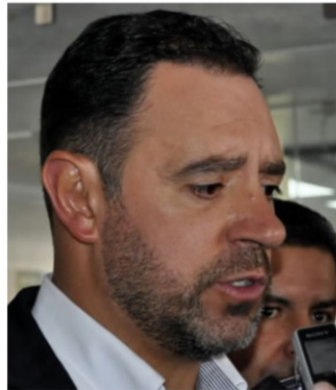
Alejandro Tello Cristera