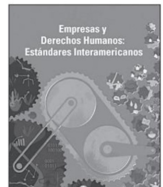
El Informe Empresas y Derechos Humanos: Estándares Interamericanos

Eso sí, advierto que la respuesta a esas interrogantes también dependerá del real acceso que se tenga a internet, puesto que la Gaceta es una publicación virtual. Al respecto, como se puede apreciar en la Encuesta Nacional sobre Disponibilidad y Uso de Tecnologías de la Información en los Hogares 2018, únicamente el 40% de la población rural usa internet. Y quizá en la región del Río Sonora sea aún menor. Por todo lo anterior cabe preguntar: ¿no sería preferible que nuestra Corte utilice vías interpretativas para llenar las lagunas en la regulación legal de las consultas, y así evitar los conflictos socio-ambientales provocados por consultas ineficaces?