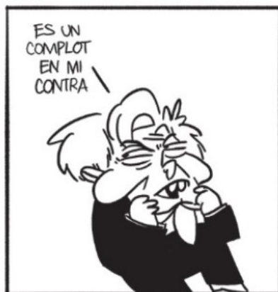
DELIRIO DE PERSECUCIÓN