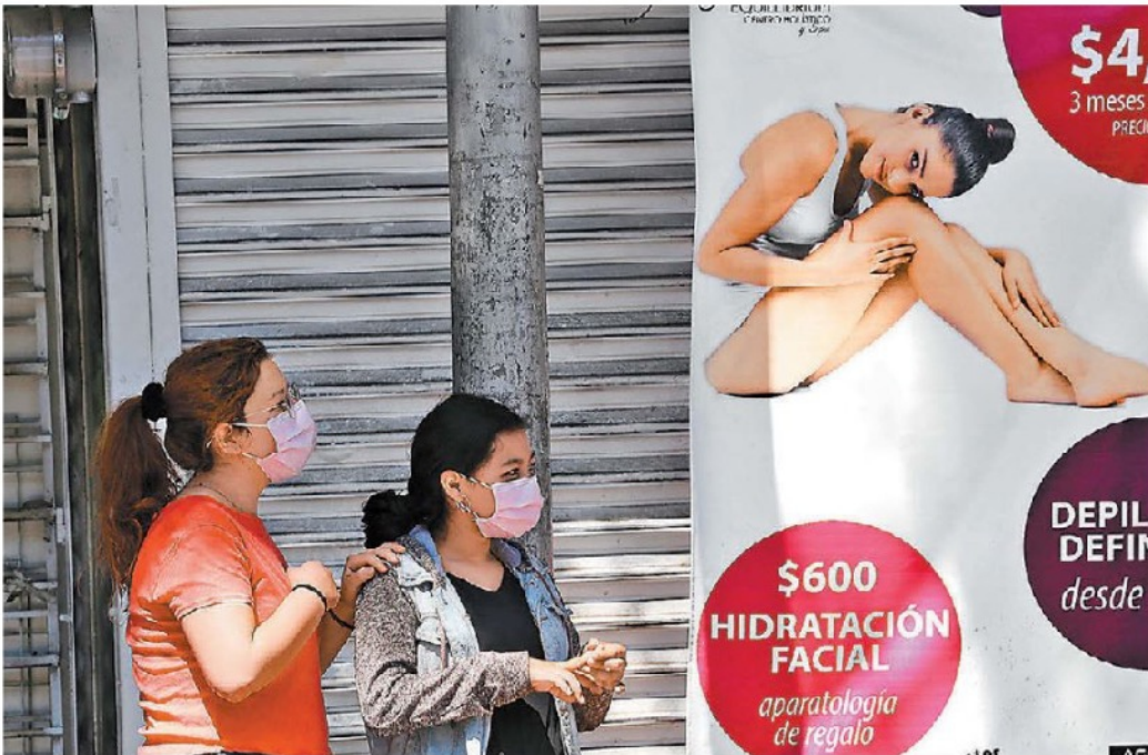
Inmediaciones del INER, donde se encuentra aislada una de las dos personas contagiadas en CdMx. OCTAVIO HOYOS