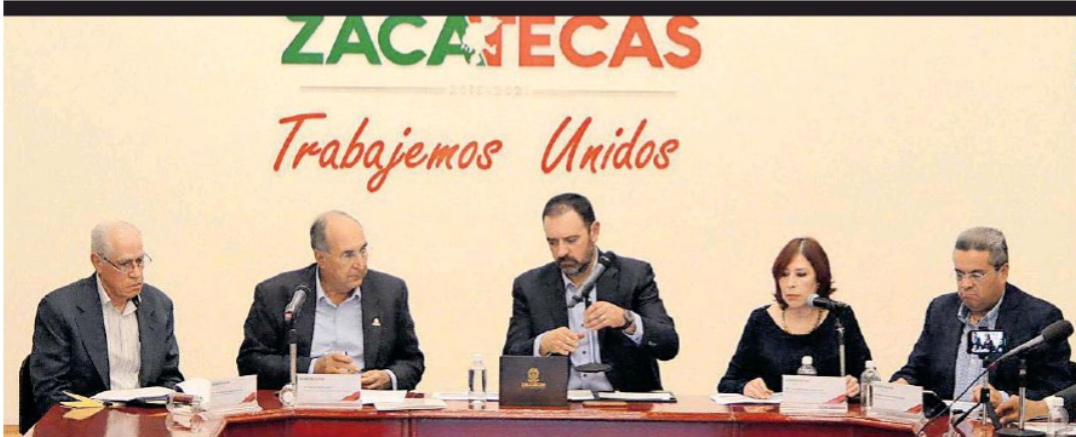
El gobernador Alejandro Tello (centro), y autoridades de salud, en conferencia de prensa, llamaron a los zacatecanos a tomar las medidas preventivas ante la llegada del coronavirus a México. En Zacatecas aún no se han registrado casos.

GILBERTO BREÑA: PEGA A GENTE DE MENOS DE 50 AÑOS