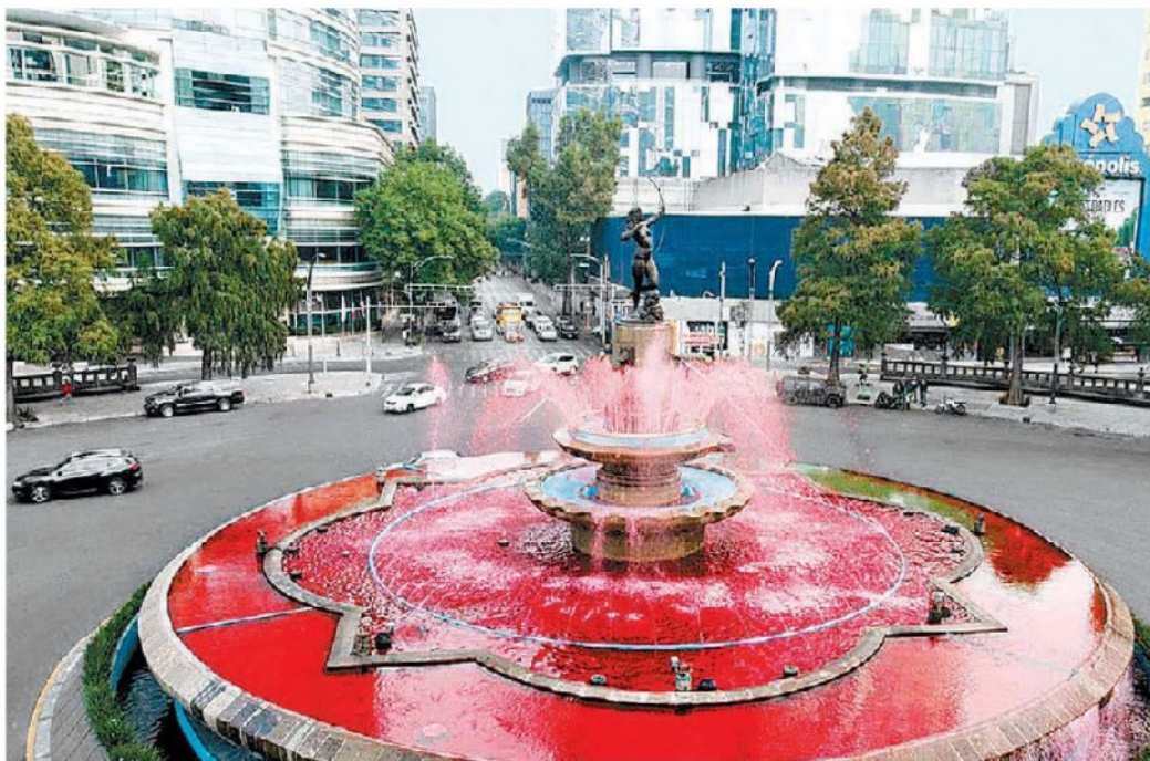
La fuente de la Diana Cazadora, en Cdmx, amaneció teñida de rojo, previo al Día Internacional de la Mujer. ESPECIAL