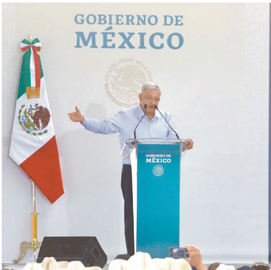
Al reunirse con beneficiarios de los programas de Bienestar en Jerez, el titular del Ejecutivo previó que las pensiones y becas serán aprobadas en breve como derecho constitucional.