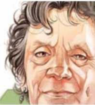
Ilustración: Horacio Sierra