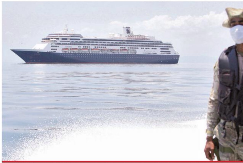
El Zandaam, de Argentina, inmóvil frente a las costas de Panamá; se teme la repetición de la tragedia del Diamond Princess.

Otro crucero enfermo, varado y con 4 muertos