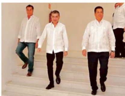
Los Gobernadores de Nuevo León, Jaime Rodríguez; Coahuila, Miguel Ángel Riquelme, y Tamaulipas, Francisco García, tuvieron su segunda reunión para hacer frente al Covid-19.

Todo lo anterior deberá realizarse evitando la especulación de precios y el acopio de bienes esenciales.