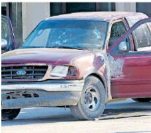
EL SOL DE ZACATECAS

La tarde de este viernes, a plena luz del día, se recibió el reporte al servicio de emergencias 911 la detonación de arma de fuego salida norte del municipio. Pág. 4