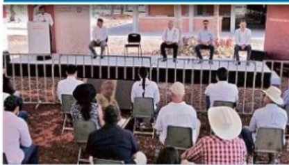
El Presidente emprendió una gira de fin de semana que lo llevará a Nayarit (foto), Baja California y Sinaloa.

*No se ha anunciado un paquete fiscal, aunque sí se ha prometido acelerar transferencias a los estados y mantener programas sociales