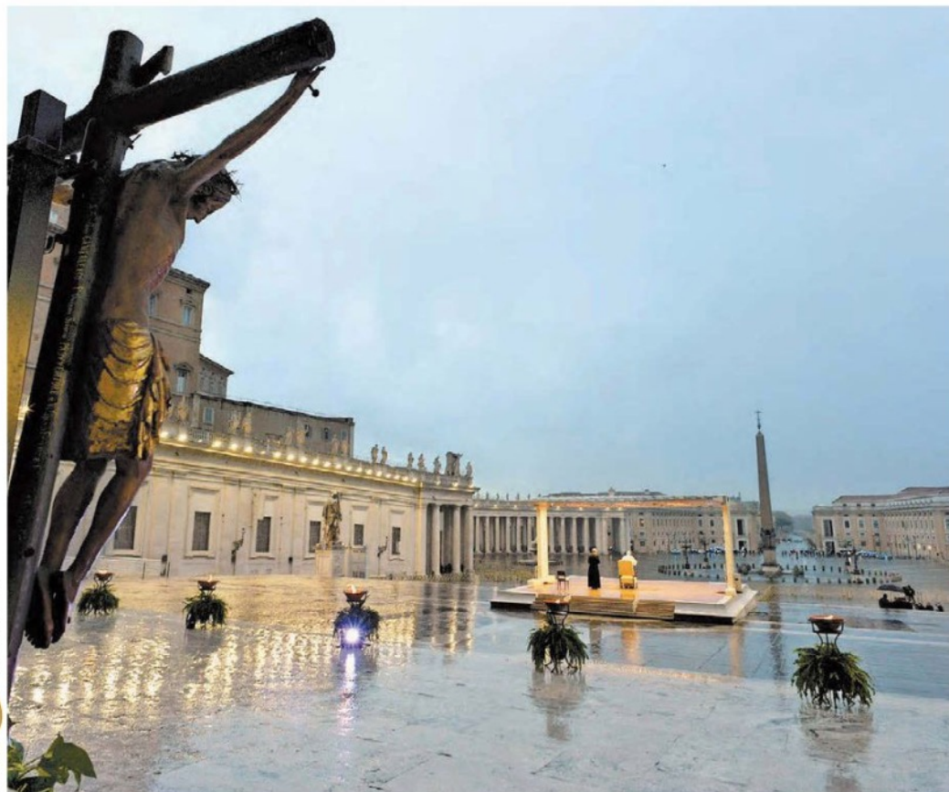
En un dramático servicio en la desolada Plaza de San Pedro, Francisco envió una bendición urbi et orbi por la pandemia.

Mensaje al pueblo. AMLO: todos a casa y a "aguantar el retiro"