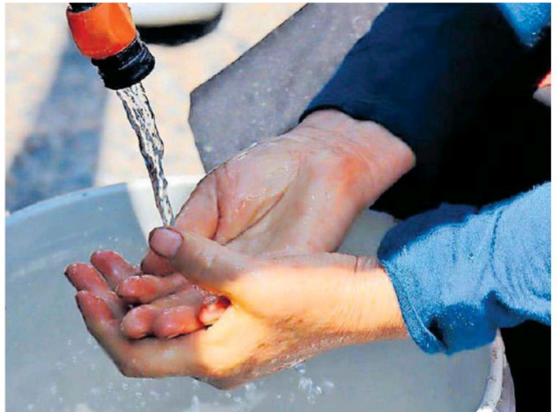
JIAPAZ flexibilizará pagos a usuarios que no puedan cubrir el consumo.

Se aceptarán parcialidades en pagos, tanto del consumo actual como en adeudos, para que los usuarios no acumulen montos y a la vez hacer llegar recursos a la Jiapaz para poder seguir operando. Pág. 6