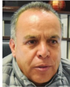
CLISERIO DEL REAL, titular del SNE.

Cliserio del Real , titular del Servicio Nacional del Empleo, espera que unos días lleguen las cifras del marzo en cuanto a creación o disminución de empleos. El panorama con la pandemia del Coronavirus se vislumbra de miedo. Evidentemente se esperan datos muy malos, y la única esperanza que se tiene es que el trancazo no sea tan duro.