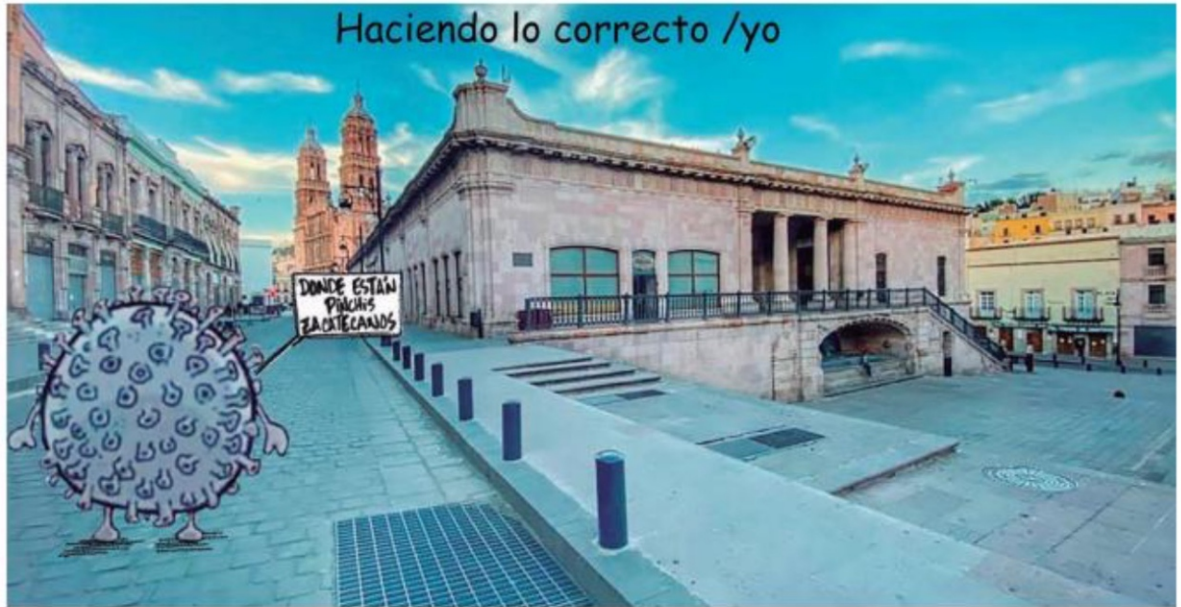
Haciendo lo correcto /yo

—Rey: Veamos... Mmmmm la violencia no baja... Sólo 3 de cada 10 habitantes del reino dice que soy buena gente... El emperador nos acaba de mandar cien mil ducados de oro para hacer frente a la emergencia... Pero nos quita noventa mil que ya le había pedido pres-