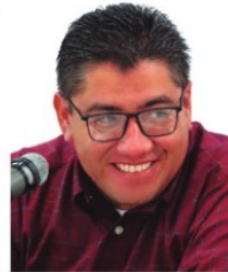
SAÚL MONREAL ÁVILA , alcalde de Fresnillo.

El alcalde de Fresnillo, Saúl Monreal , ya tiene terminadas algunas obras de infraestructura y pavimentación, como en Los Fresnos, pero no puede inaugurarlas por el asunto de la contingencia. Una vez que pasen los tiempos de emergencia, Saúl estaría emprendiendo una gira de inauguración de obras. * El presidente Andrés Manuel López Obrador fue muy cuestionado