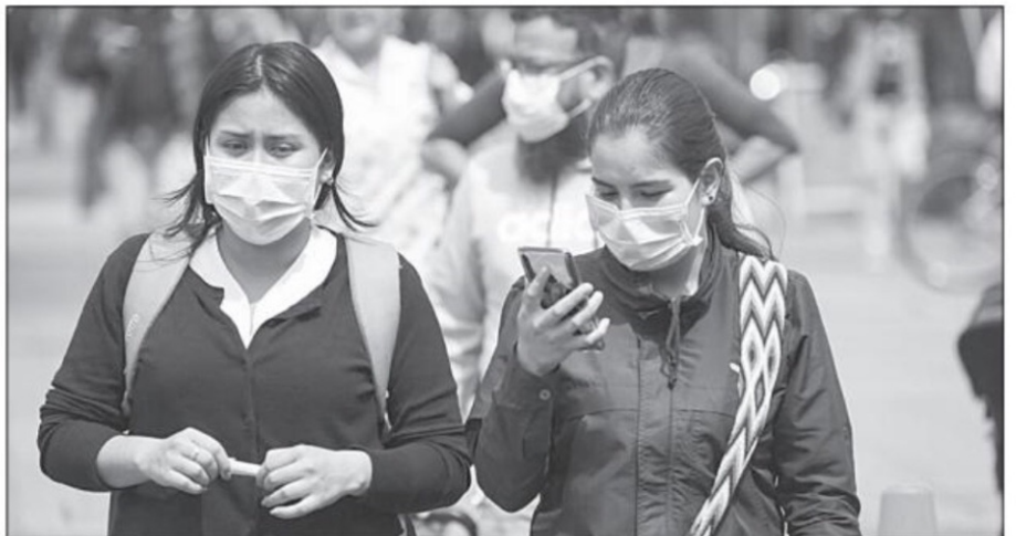
La pandemia y sus efectos sociales, económicos, políticos y culturales, han venido a presentarse como fenómenos no vistos, por el propio contexto que los rodea