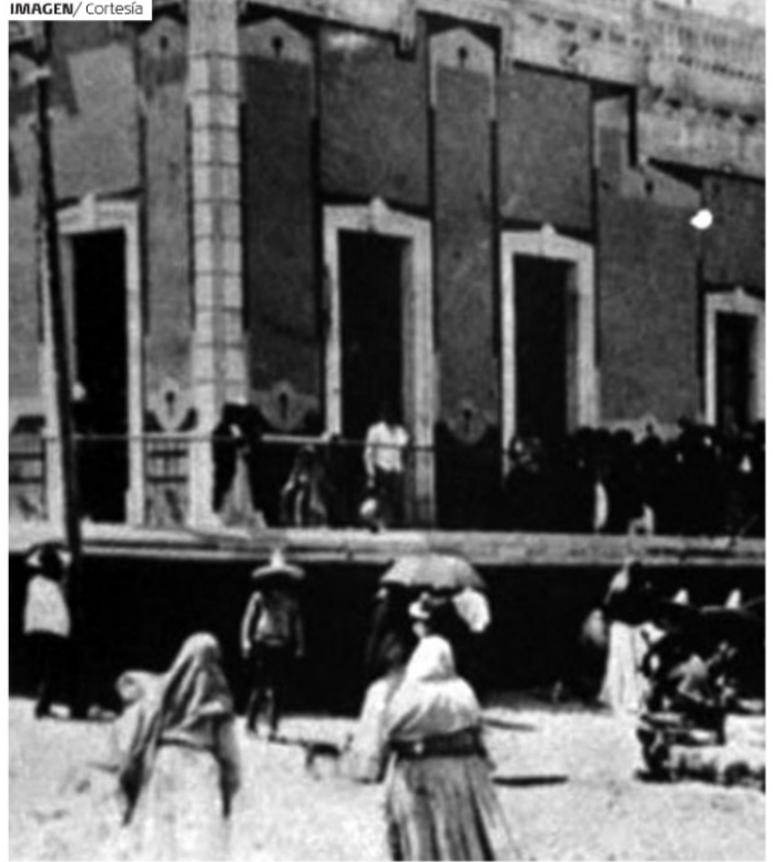
MUCHOS DELITOS se encubrieron quemando archivos o vendiéndolos.