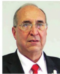
GILBERTO BREÑA, secretario de Salud.

En el estado recriminan que no se trata solo de un asunto de población o problemas del Covid-19, pues a Colima, con alrededor de 30 contagios (contra más de 100 de Zacatecas) y demográficamente más pequeño, le dieron un poco más de 55 mil insumos.