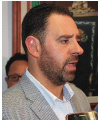
Alejandro Tello Cristerna