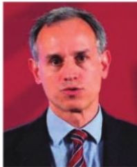
HUGO LÓPEZ-GATELL, subsecretario de Salud.

Para esas evaluaciones, en el observatorio tomaron en cuenta "la magnitud de medidas sanitarias adoptadas en cada entidad federativa, la oportunidad en su adopción y su éxito en la reducción de la movilidad poblacional, con respecto a la movilidad previa al inicio de la contingencia". Para elaborar el estudio, se recibieron fondos de la Universidad de Miami.