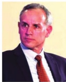
HUGO LÓPEZ GATELL , subsecretario de Salud.

militarización del país, ni toques de queda presume el subsecretario de Salud,