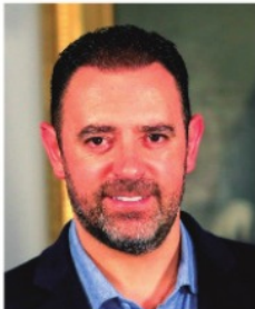
ALEJANDRO TELLO, gobernador de Zacatecas.

renunciar al uso ilimitado de sus automóviles, la iniciativa se tomó debido a la falta de respuesta de la sociedad para acatar las restricciones sanitarias. En sí, pagarían justos por pecadores, pero de lo que se trata es que a final de cuentas se reduzca la movilidad en la entidad. Por cierto, hay alcaldes que dicen no haber sido consultados de la medida y dudan que las delegaciones