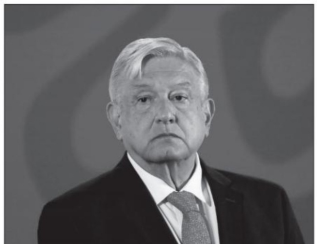
Más tardó el presidente en tomar posesión que en suscitar un conflicto político más, señala el colaborador