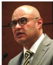
FRANCISCO MURILLO, Fiscal General del Estado.

Se dice que la Fiscalía General de Justicia del Estado, dirigida por Francisco Murillo Ruiseco , iba por dos presuntos delincuentes "pesados" que vivían en Bernárdez. Pero el trabajo que hicieron en las carpetas de investigación no fue suficiente para que el juez los procesara y se determinó dejarlos en libertad. El par de acusados había sido detenido hace tres semanas durante un operativo.