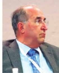
GILBERTO BREÑA, secretario de Salud.

El grillero sindicalista, además de poder perder su licencia, estaría metido en una bronca legal, pues una familia lo habría denunciado por negligencia, pues supuestamente se negó a operar a una niña, más preocupado por asuntos de grilla que por cumplir su juramento de Hipócrates.