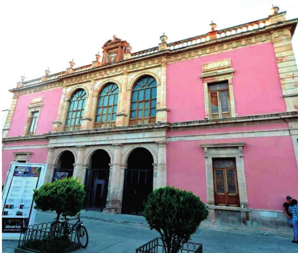
FEDERICO MANUEL GUTIÉRREZ convirtió al teatro Echeverría en una gigantesca cantina y casino.

diputado estatal es electo diputado federal. El 13 de marzo de 1927 celebra una convención en el Hospicio González Echeverría para promover la reelección del Gral. Álvaro Obregón, al resultar electo, Guillermo C. Aguilera adquiere más poder. Se convierte en el político más poderoso del Estado de Zacatecas.