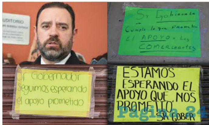
Alejandro Tello Cristerna