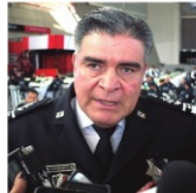
ISMAEL CAMBEROS , secretario de Seguridad.

De todo lo malo que ha sucedido en el sistema penitenciario: fugas de reos, muertes y otras barbaridades, al menos ayer algo le salió bien al secretario de Seguridad, Ismael Camberos . Contuvieron un conflicto entre reos y le habrían salvado la vida al por lo menos a un interno. Hay muchos asuntos pendientes en seguridad que esperan que atienda Camberos. Uno de ellos es la inauguración de la primera etapa de la Unirse en Fresnillo, en unos 20 días. El alcalde Saúl Monreal espera que realmente se tengan resultados con la obra.