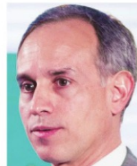
HUGO LÓPEZ-GATELL, subsecretario de Salud.

Por cierto, hay quejas de una buena parte de la burocracia por el Programa Hoy no Circula, aunque ya solo sea una vez al día. Estos servidores públicos no están dispuestos a viajar en camión, aunque al ser de las actividades esenciales no deben tener impedimento para circular.