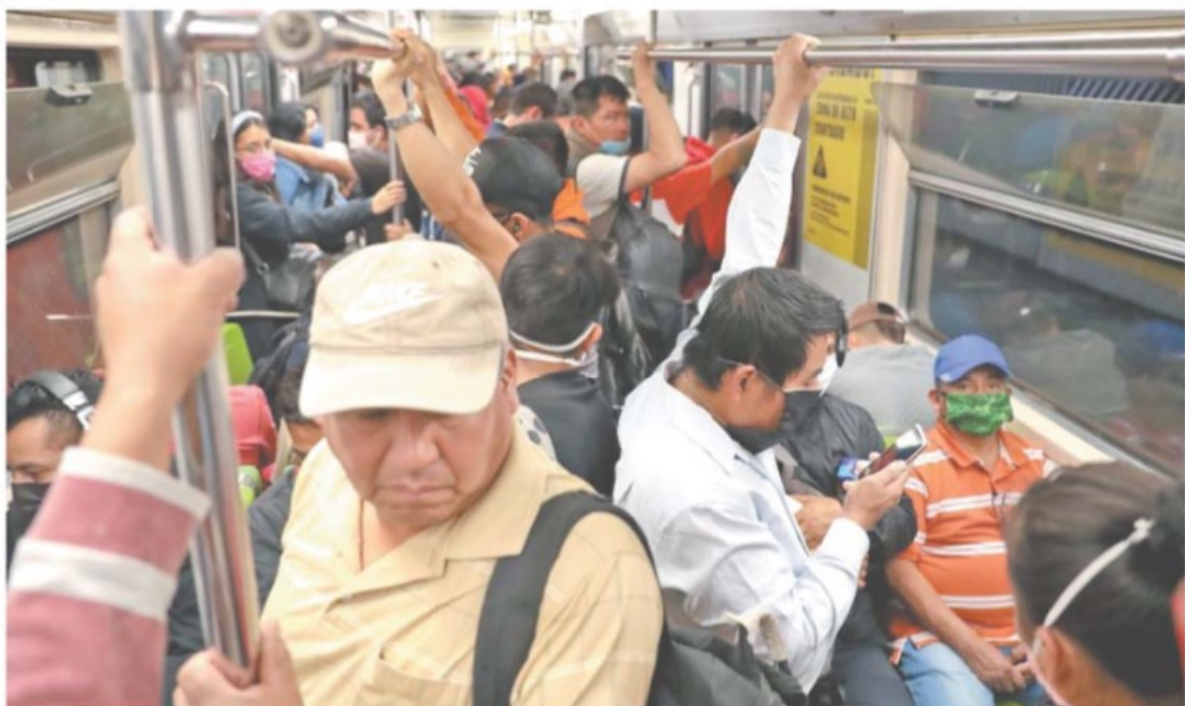
La sana distancia en el Metro fue imposible. Vagones de la Línea 3 lucieron atiborrados, a pesar de que en estos días se prevén más contagios.