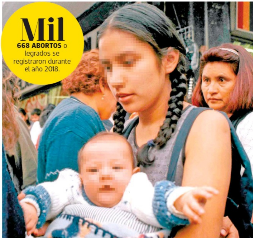
En Zacatecas, cientos de niñas y adolescentes ya se convirtieron en mamás.

Según cifras brindadas por la Dirección General de Información en la Salud de la SINAIS a través de la plataforma de transparencia del Instituto Zacatecano para el Acceso a la Información y Protección de Datos Personales (IZAI), durante el 2018 en el territorio del estado se realizaron mil 668 abortos o legados de manera legal en alguna unidad médica de la Secretaría de Salud de Zacatecas. Pág. 7