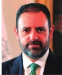
ALEJANDRO TELLO, gobernador de Zacatecas.

Ayer por la tarde, el estado llegó a 336 casos de coronavirus desde que llegó la pandemia. Cada día salen más enfermos del Covid-19 y no se sabe cuándo acabará la curva de contagios. El gobernador Alejandro Tello entiende que mucha gente ya está desesperada y que en algunos casos se han relajado los cuidados de prevención. Pero si el número de contagios no disminuye, tendrán que volver a imponer medidas severas de restricción.