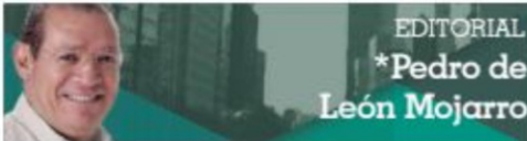
EDITORIAL *Pedro de León Mojarro

Felices y orgullosos se mostraron los panistas de Zacatecas de que se uniera, a las filas del partido albiazul, la antes independiente, antes Morena, senadora Lilly Téllez. La dirigente estatal del PAN, Noemí Luna, le dio la bienvenida a la también antes conductora porque "súper común que políticos brinquen de partido cuando buscan chamba", pero aplausos cuando se renuncia "se va a la oposición por una cuestión de conciencia". En abril, cuando Lilly Téllez dejó la bancada de Morena por "diferencias de criterio", entre sus agradecidos, además del presidente López Obrador, estuvo el senador zacatecano Ricardo Monreal, quien le dedicó un "que Dios la ayude". ¿La líder del PAN en el estado todavía estará interesada en el que nombraron bloque antimonreal?