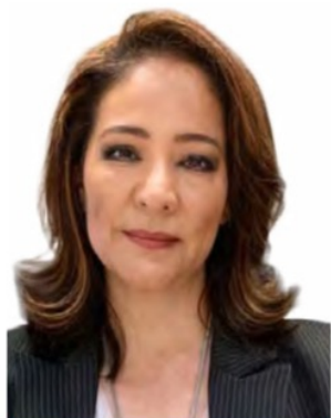
MARÍA DEL CARMEN SALINAS

Tesorera del Senado de la República. Contadora pública y maestra en Finanzas; apasionada por el servicio público con una carrera de 25 años; comprometida con la inclusión de las mujeres en el mundo de las finanzas.