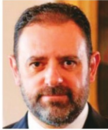
ALEJANDRO TELLO, gobernador de Zacatecas.

En el equipo del gobernador Alejandro Tello comienzan a hartarse de la falta de apoyo del Gobierno Federal para enfrentar el coronavirus. Se sabía muy bien que una de las posturas del gobernador era