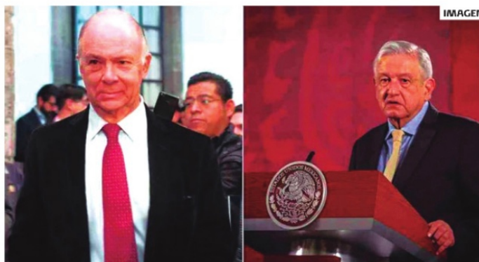
EL INTELLECTUAL ENRIQUE KRAUZE Y EL PRESIDENTE ANDRÉS MANUEL LÓPEZ OBRADOR.

mexicanos tengamos muy bien pagados a diputados, senadores, ministros de la Suprema Corte y demás mientras que tenemos a más de la mitad de los mexicanos en la pobreza? Pues sean sinceros y pidan el apoyo de los mexicanos para que el gobierno dé marcha atrás.