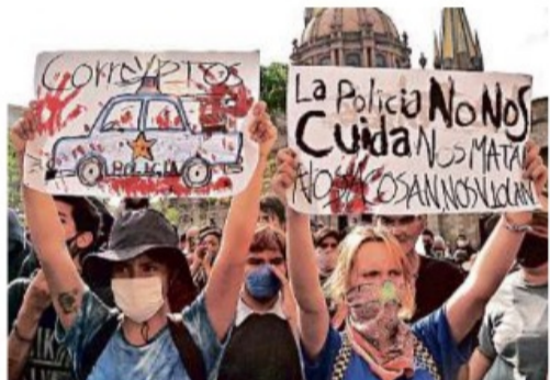
La marcha de ayer, para repudiar la brutalidad policiaca en Jalisco, terminó frente al Palacio de Gobierno estatal.

"¿Quién dio la orden y quién dio esta instrucción?, evidentemente no fue el Fiscal del Estado, tenemos certeza de eso. Lo que tenemos también es la obligación de