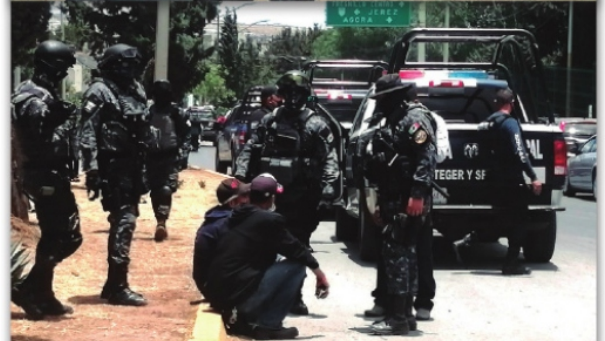
LOS ELEMENTOS POLICIACOS resguardaron el lugar para controlar a los mineros.