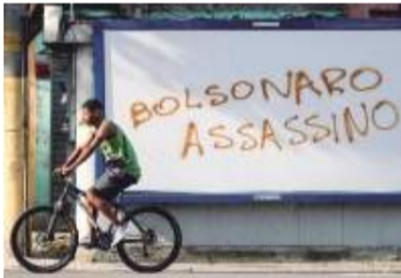
UN HOMBRE pasa junto a un graffiti, "Bolsonaro asesino", en Río de Janeiro, ayer.