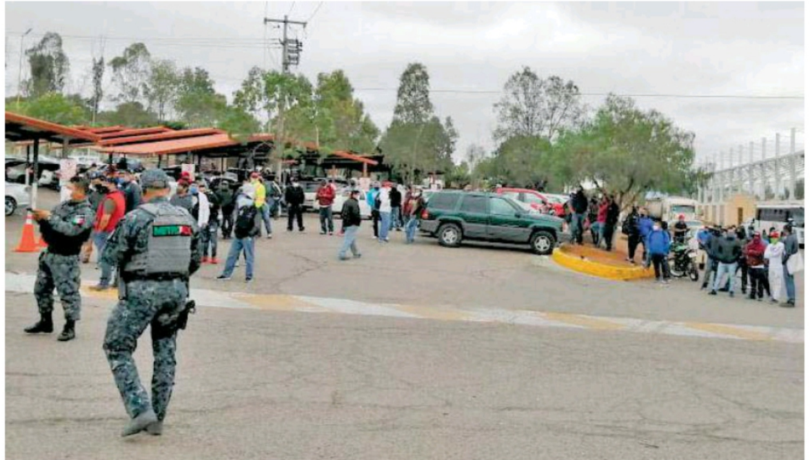
La mañana de ayer viernes tuvo lugar el enfrentamiento entre mineros, que dejó ocho lesionados, provocado por el surgimiento de un nuevo sindicato al interior de la empresa minera Fresnillo PLC.