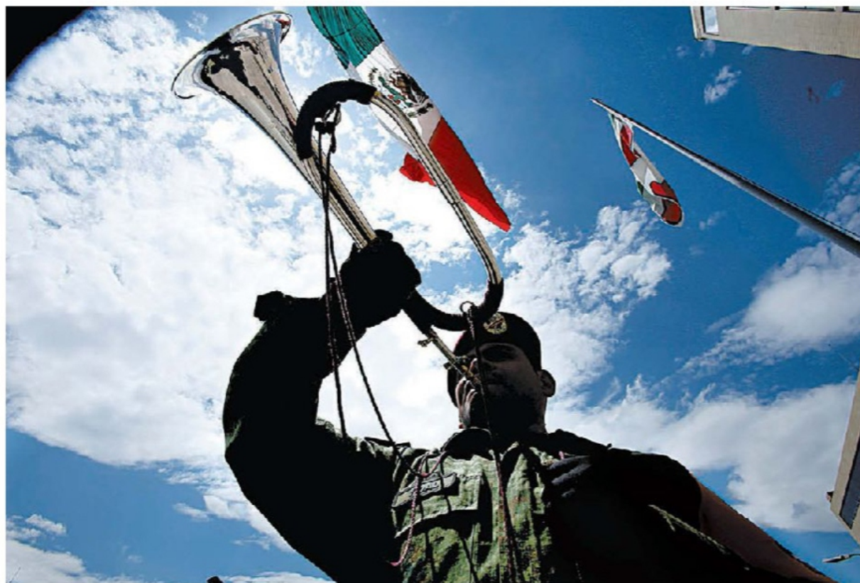
La Sedena honró a las víctimas del coronavirus, que ya rebasan las 16 mil en México, con un "toque de silencio". JUAN CARLOS BAUTISTA