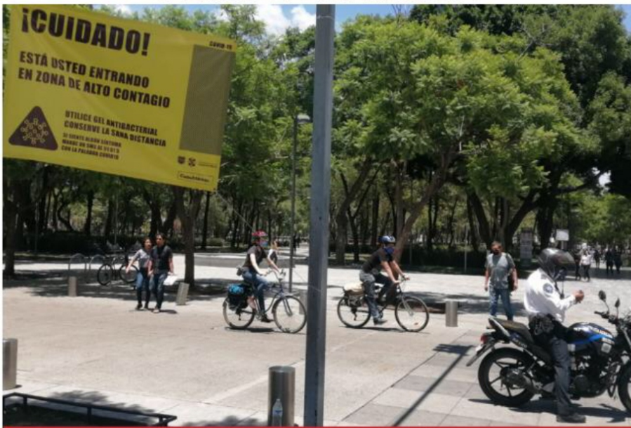
La nueva normalidad dio inicio con la apertura de varios lugares públicos capitalinos, entre ellos la Alameda Central.

Habrá apertura gradual en la industria manufacturera a partir del día 16, se abren el comercio de barrio y servicios profesionales; finaliza el Hoy No Circula temporal y reabren estaciones de Metro y Metrobús