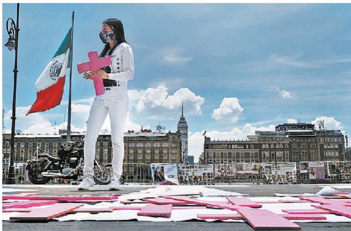
Familiares de desaparecidas y víctimas de feminicidio colocaron cruces rosas en la plancha del Zócalo para exigir justicia.