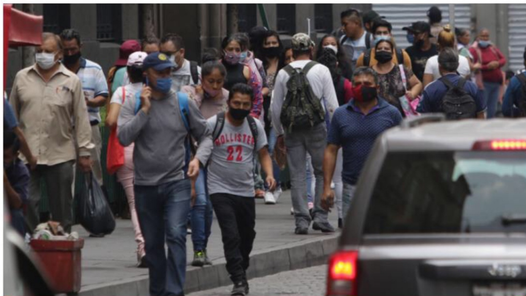
Con la pandemia al alza, los cruceros antes poco transitados, ayer, ya se observaron con mucho movimiento...la gente dejó atrás el confinamiento. 12

La jefa de Gobierno anuncia el proyecto más relevante de movilidad hasta ahora