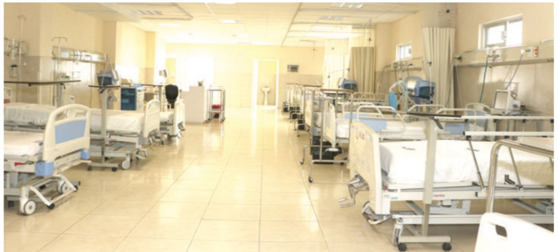
Se trata de la unidad ubicada en la avenida García Salinas de la capital del estado

Uneme de la SSZ Suspende Consulta Externa y Urgencias