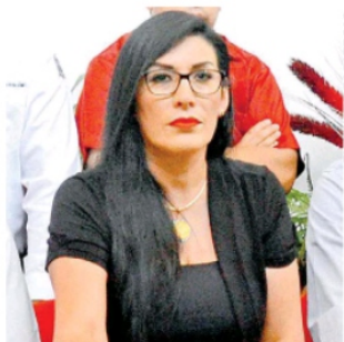
EL SOL DE ZACATECAS

4 MIL VIVIENDAS se producen en promedio anualmente a nivel estatal: Canadevi