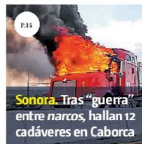
Sonora. Tras "guerra" entre narcos, hallan 12 cadáveres en Caborca