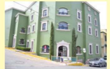
Todos Exigen el Apoyo del Gobernador Alejandro Tello

Los Comercios en Zonas Escolares Siguen Resintiendo Efectos Negativos Pandemia