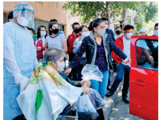
La Secretaría de Salud de Zacatecas, registró ayer 22 nuevos contagios de Covid-19.

El paciente también padecía asma, Enfermedad Pulmonar Obstructiva Crónica (EPOC) e inmunosupresión. Estaba hospitalizado en la Unidad COVID