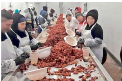
Tras contagiarse de Covid, dos mexicanas fueron despedidas de una distribuidora de cangrejos en Louisiana.