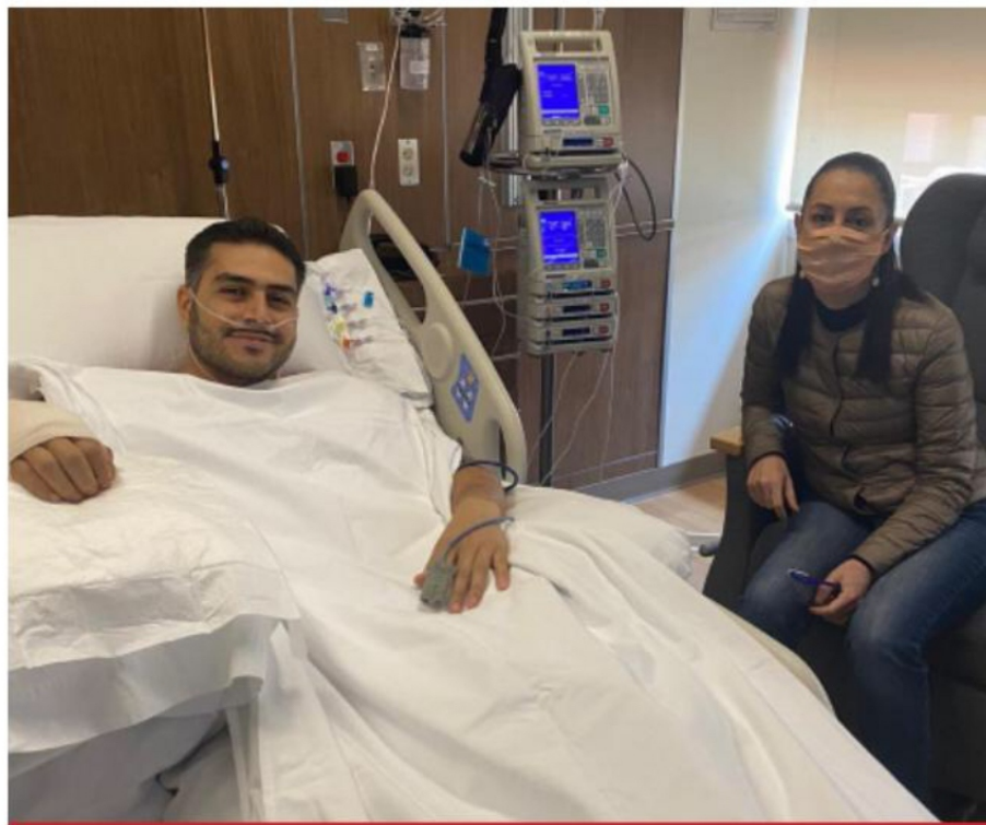
Claudia Sheinbaum divulgó esta foto en su cuenta de Twitter de su visita a Omar García Harfuch en el hospital.

C laudia Sheinbaum, jefa de Gobierno de la Ciudad de México, visitó este sábado a Omar García Harfuch, secretario de Seguridad Ciudadana, quien se recupera en un hospital tras ser intervenido quirúrgicamente luego de haber recibido tres impactos por arma de fuego durante un ataque perpetrado por el Cártel Jalisco Nueva Generación (CJNG).