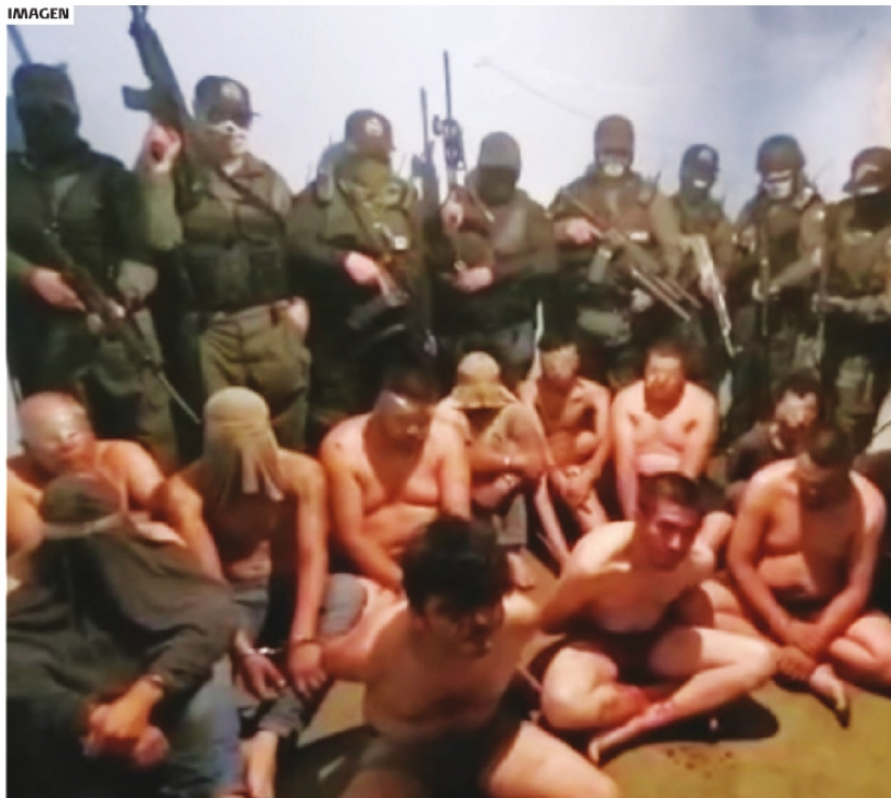
EN REDES SOCIALES SE DIFUNDIÓ UN VIDEO en el que son interrogados por integrantes del Cártel de Sinaloa.